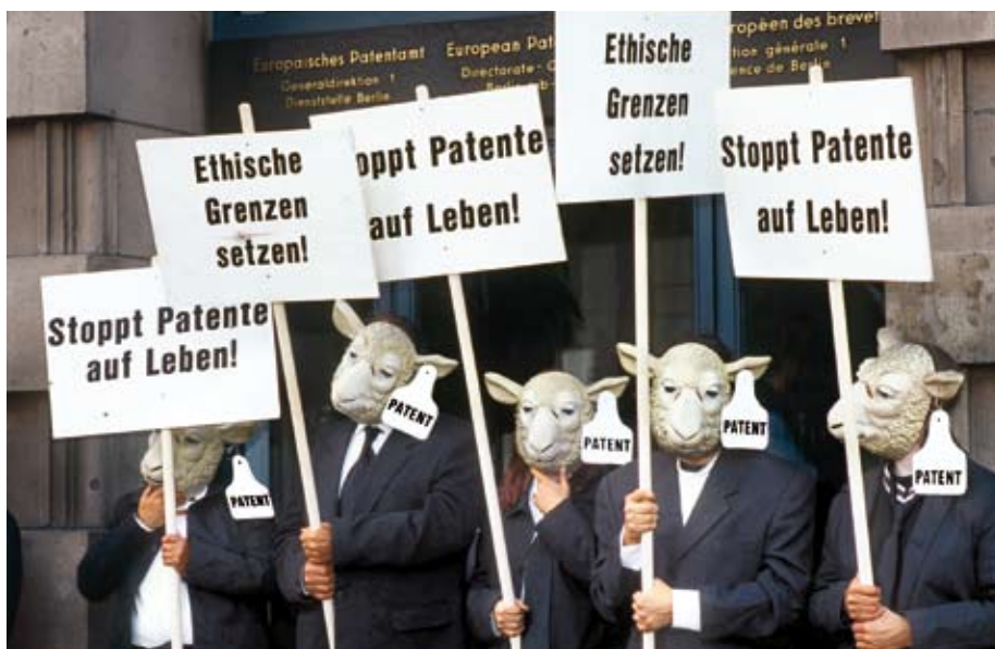
Greenpeace-Protest gegen fragwürdige Patentvergabe beim Europäischen Patentamt.

Mit Patenten versucht sich die Industrie, ein Monopol über die landwirtschaftliche Produktion und Ernährung zu verschaffen. Patente im Bereich Landwirtschaft können exklusive Rechte über Saatgut, Ernte bis hin zu den Lebensmitteln beinhalten. Die Konzerne diktieren dann, wer was zu welchen Bedingungen und Preisen anbauen und verkaufen darf: vom Weizen bis zum Brot, vom Mais bis zum Popcorn.