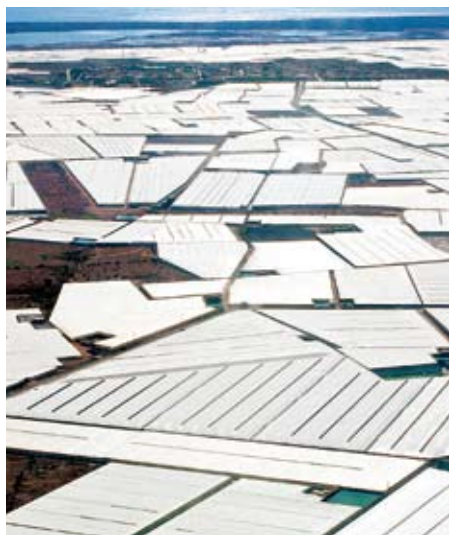
Plastikfolien-Gewächshäuser in Almeria

müssen allein die Wasserwerke ausgeben, um die Giftfracht aus dem Trinkwasser zu entfernen.