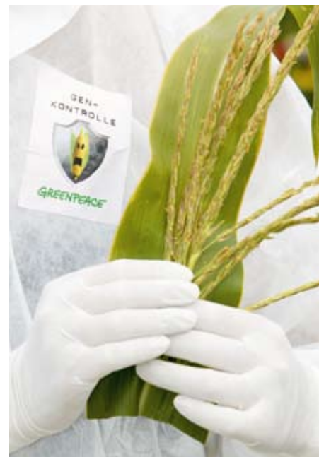
Pflanzenprobe von Gen-Mais der Firma Monsanto.

auf 1,2 Milliarden US-Dollar geschätzt. 2011 einigte man sich auf eine Vergleichszahlung in Höhe von 750 Millionen US-Dollar. Der Export von US-Reis leidet weiterhin unter dem Skandal, obwohl mit hohem Aufwand der Gen-Reis zurückgedrängt werden konnte. Verunreinigungen mit Gen-Pflanzen kommen immer wieder vor. Dies macht deutlich, dass die Industrie das Problem keineswegs unter Kontrolle hat, die Behörden der Situation oft hilflos gegenüberstehen.