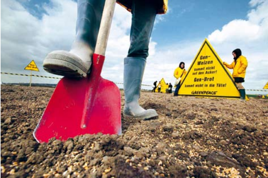
Gegen die geplante Freisetzung von Gen-Weizen durch Syngenta säen Greenpeacer auf der Versuchsfläche Bio-Weizen aus.

Die Saatgut- und Chemiekonzerne, allen voran Monsanto, Bayer, Dupont, Syngenta und BASF, richten mit Pestiziden große ökologische Schäden an. Gleichzeitig fahren sie satte Gewinne ein. Seit Jahren versuchen sie nun, uns auch mit der Gentechnik zu beglücken. Ihre Versprechen: gesündere Nahrungsmittel, höherer Ertrag durch Gen-Pflanzen und geringerer Einsatz von Pestiziden. Ihr Ziel dabei ist aber, die gesamte Lebensmittelkette, vom Saatgut bis zum Essen, in die Hand zu bekommen. Den Verbrauchern sollen riskante Nahrungsmittel schmackhaft gemacht werden, Landwirte werden in eine stärkere Abhängigkeit von den Konzernen getrieben.