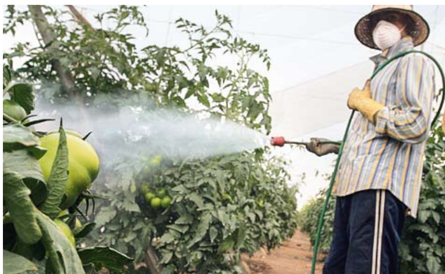
Kaum geschützt: Arbeiter an der spanischen Küste beim Spritzen der Pestizide