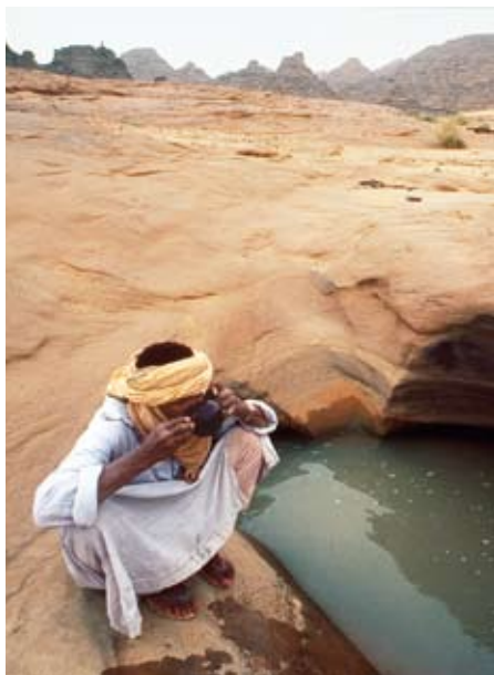
Die Wasserressourcen werden in Nordafrika knapp.

Landwirtschaft und Industrie stark zu, und mit ihm die Nutzungskonflikte um die kostbare Ressource.