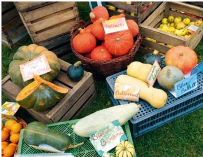
Tiere, Gemüse und Produkte aus Eigenerzeugung können auf der Jahresauktion in Warder ersteigert werden.