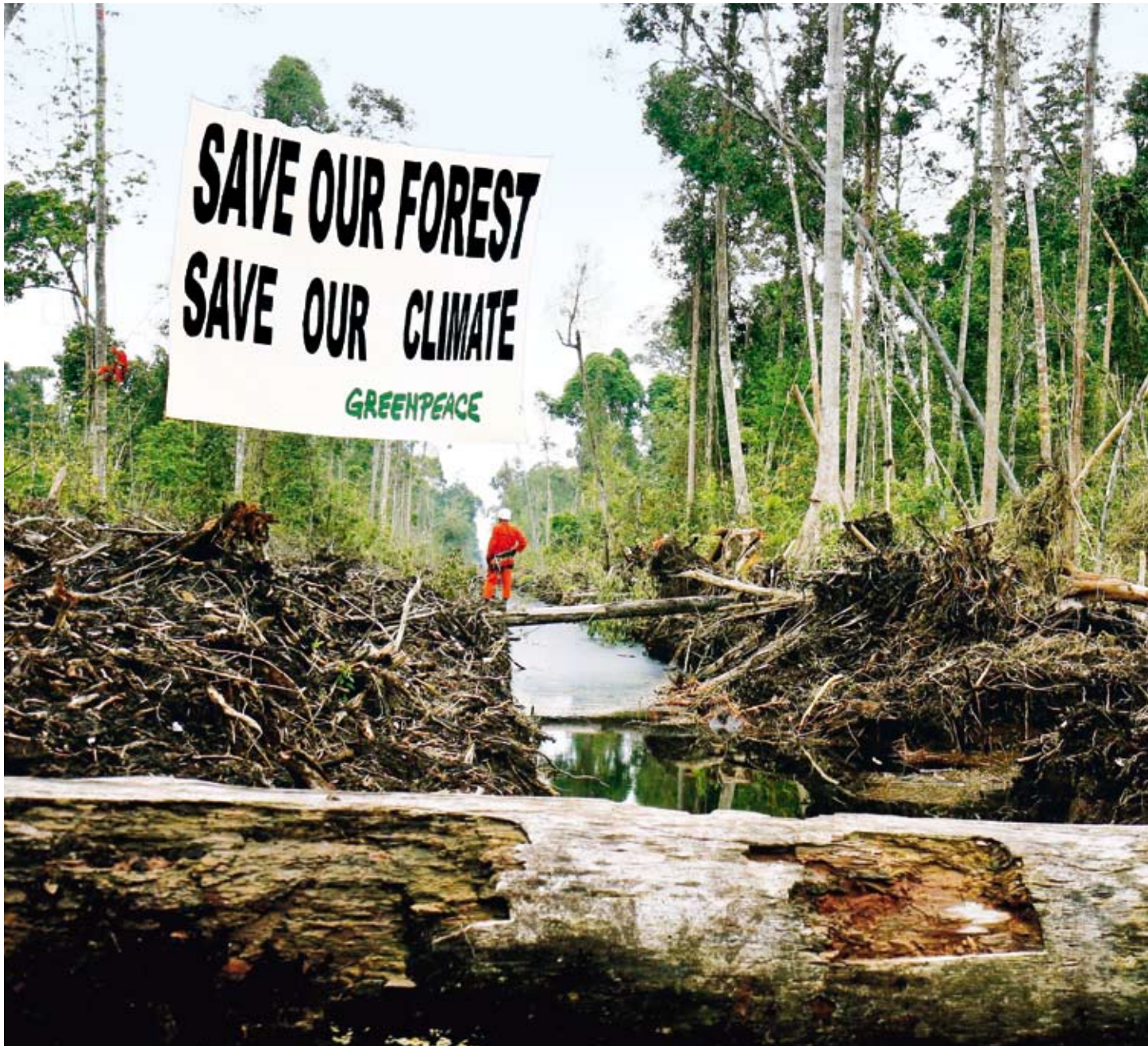
Greenpeace protestiert im indonesischen Regenwald gegen die Zerstörung der Wälder für Ölpalm-Plantagen.

Japan und Indien zeigen, dass es bei anderen Gewohnheiten und kulturellem Hintergrund auch anders geht. Weniger oder gar kein Fleisch zu essen, wäre ein Mittel gegen die Erderwärmung. Die Tierhaltung ist hauptverantwortlich für den weltweit steigenden Wasserverbrauch, vor allem durch die Bewässerung und Beregnung von Futtermittelpflanzen. Während der Wasserbedarf von weidenden Tieren zu einem Großteil über das Futter direkt gedeckt wird, enthalten Getreide und Kraftfutter nur wenig