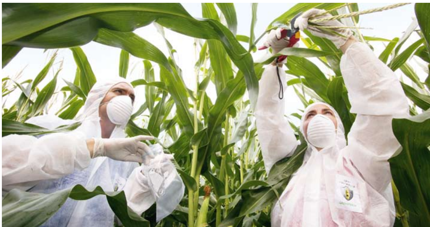
Seit langem ist Greenpeace gegen den in Europa bisher erlaubten Gen-Mais der Firma Monsanto aktiv - mit Erfolg: Im April 2009 wird die Aussaat von Mon810 in Deutschland verboten.

Greenpeace hat auch dazu beigetragen, dass die EU im Jahr 2009 ein schärferes Zulassungsrecht für Pestizide verabschiedet hat. So dürfen beispielsweise krebs-erregende, erbgutschädigende oder die Fortpflanzung beeinträchtigende Pestizide gar nicht mehr vermarktet werden. Doch viele gefährliche Pestizide bleiben auf dem Markt, zum Beispiel solche, die das Immunsystem beeinträchtigen, das Hormon- oder das Nervensystem stören.