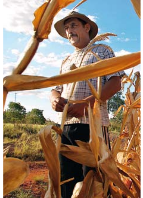
Der Einsatz von Genpflanzen garantiert langfristig keine höheren Erträge.

Nutzbare Flächen für Acker- und Grünland sind aus klimatischen und geologischen Gründen begrenzt. Weltweit wird ein Drittel der Landfläche, circa 5 Milliarden Hektar, landwirtschaftlich genutzt: 1,5 Milliarden Hektar davon als Äcker, weitere 3,5 Milliarden Hektar als Wiesen und Weiden.