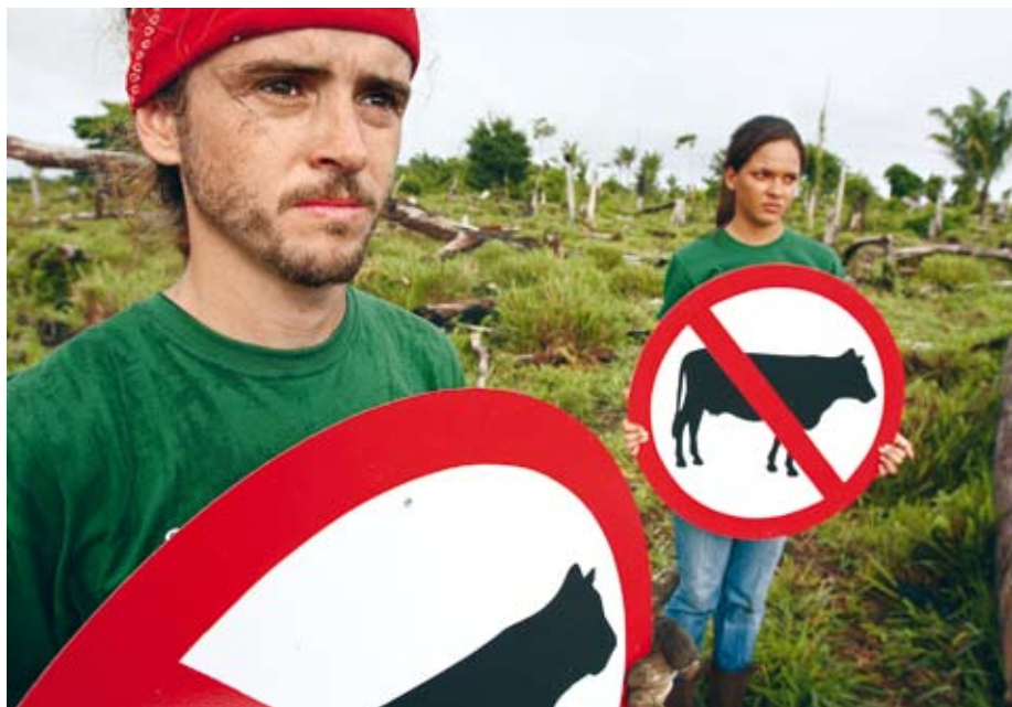
Greenpeace protestiert in Brasilien gegen die Abholzung von Urwald für Rinder-Weideland.