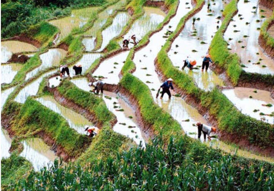
In China wird Reis auf Terrassen angebaut, um auch Berghänge zu nutzen.