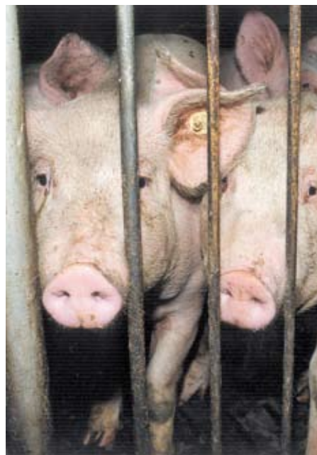
So leben Schweine in der Massentierhaltung.

Die Globalisierung hat weltweit erhebliche Folgen für die Landwirtschaft. Da der Transport von Agrargütern relativ günstig ist, wird ein immer größerer Teil der Welternäte international gehandelt. Zum Beispiel importiert die EU Obst aus Übersee, außerdem immer mehr eiweißreiche Futtermittel wie Soja. Mit diesen Futtermitteln werden in Europa Fleisch und Milch im Überschuss produziert, um diese dann nach Russland, Asien und in südliche Länder zu exportieren.