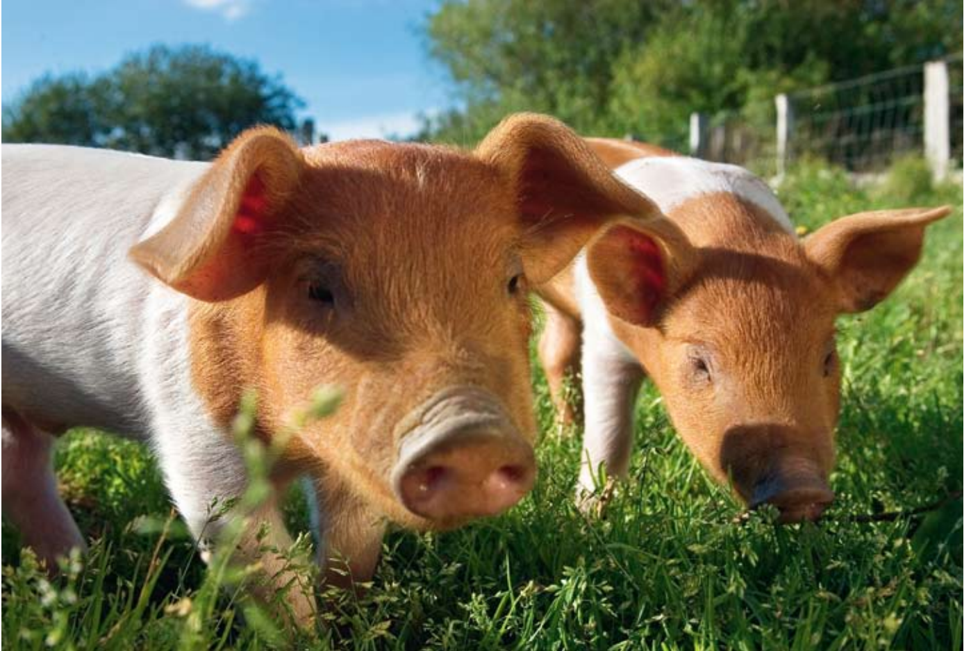
Der schleswig-holsteinische Tierpark Arche Warde beherbergt circa 1.100 Tiere alter Haus- und Nutztierassen.

Die industrielle Landwirtschaft ist für gravierende Umweltprobleme verantwortlich: Pestizide finden sich im Grundwasser wieder, der Anbau von Monokulturen verschlingt enorme Mengen an Wasser und zerstört in kurzer Zeit fruchtbare Böden.