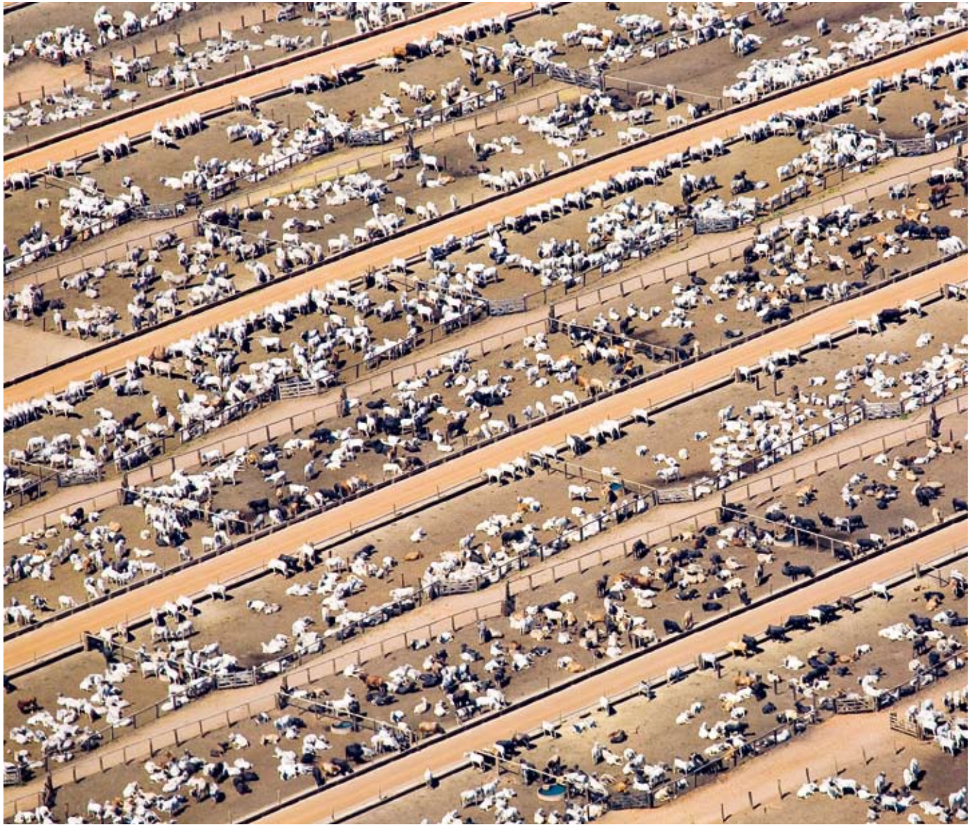
Viehzeit beansprucht 70 Prozent der landwirtschaftlich genutzten Fläche in Brasilien.

Steigende Durchschnittstemperaturen, Extremwetter, Stürme, Überschwemmungen und lange Trockenzeiten: Der Klimawandel ist bereits Realität. Die Landwirtschaft ist dabei Opfer und Täter.