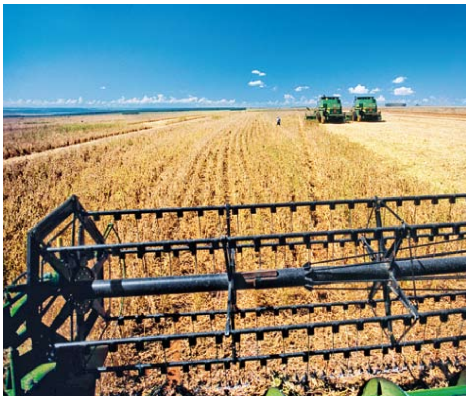
Im brasilianischen Mato Grosso werden jährlich 5,5 Millionen Hektar Land als Soja-Anbaufläche genutzt.

Lachgas ist ein besonders langlebiges Klimagas, das sich im Schnitt erst nach 114 Jahren abbaut und 300-fach so klimaschädlich ist wie CO 2 . Vor allem beim Einsatz von Stickstoffdünger und Dung aus der Tierhaltung wird es freigesetzt. In den letzten 50 Jahren hat sich der Mineralstickstoffeinsatz weltweit verachtfacht, proportional dazu ist die Lachgas-Kon-