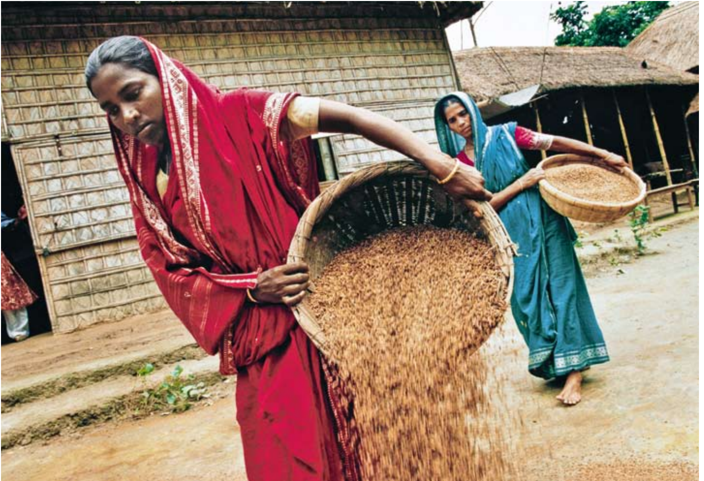
In Bangladesch betreiben Frauen nachhaltige Landwirtschaft, z. B. trocknen sie ihr Saatgut in der Sonne.

Hunger und Armut sind in erster Linie ein politisches und soziales Problem: Über 880 Millionen Menschen hungern weltweit, obwohl ausreichend Lebensmittel produziert werden. Verursacht wird dies durch unfaire Handelsbedingungen, Kriege, politische Strukturen und fehlenden Zugang zu Ressourcen wie Land, Wasser, Saatgut oder finanzielle Mittel. Allein mehr Lebensmittel zu produzieren, kann den Hunger also nicht besiegen. Auch Klimawandel und Wetterextreme beeinflussen die Landwirtschaft und damit die weltweite Lebensmittelproduktion. Betroffen sind in erster Linie Kleinbauern und Konsumenten in den Ländern des Südens.