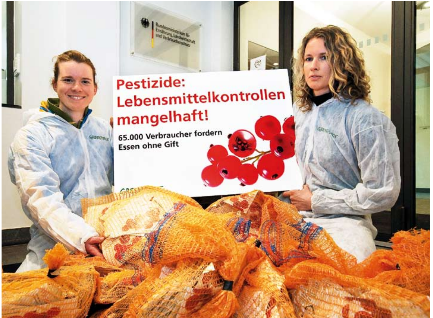
Der ehemalige Verbraucherminister Seehofer bekommt 65.000 Protestkarten, weil seine mangelhafte Kontrolle Verbraucher schlecht vor Pestiziden in Lebensmitteln schützt.

Die Kette von Skandalen reißt nicht ab. Im Preiskampf um die billigsten Nahrungsmittel bieten die Supermärkte Masse statt Qualität: Im Einkaufskorb landet pestizidbelastetes Obst und Gemüse sowie Fleisch, das zu über 90 Prozent aus der Massentierhaltung stammt. Auch die Gentechnik ist nicht vom Tisch: Über die Futtermittel bahnt sie sich den Weg zum Verbraucher.