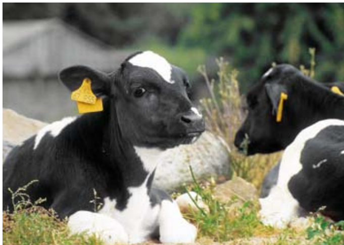
Das schwarzbunte Niederungsrind zählt zu den vom Aussterben bedrohten Haustierrassen.

Krankheiten und Umwelteinflüssen nicht standhalten. Das alles stellt die Landwirtschaft vor große Herausforderungen. Und eines hat sich in den letzten Jahrzehnten bereits gezeigt: Die industrialisierte Landwirtschaft kann die zukünftigen Probleme nicht lösen. Vielmehr ist sie durch die Übernutzung der landwirtschaftlichen Böden Mitverursacher unserer heutigen, dramatischen Lage. Aber es gibt Alternativen zu großflächigen Monokulturen und massivem Einsatz von Pestiziden. Gesunde Lebensmittel, gesunde Böden, sauberes Wasser und eine langfristige Sicherheit der Ernährung möglichst aller Menschen können mit einer nachhaltigen Landwirtschaft erreicht werden. Sie erhält unsere natürlichen Ressourcen, statt sie zu zerstören. Mit traditionellen und innovativen Methoden können inzwischen Pflanzen gezüchtet werden, die unterschiedlichsten Boden- und Klimabedin-