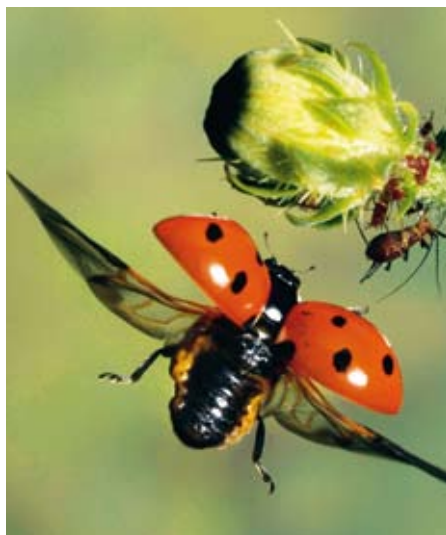
Marienkäfer auf Blattlausjagd