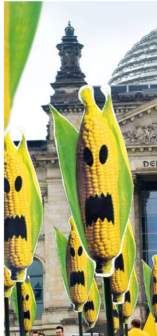
Greenpeace-Protest in Berlin gegen die unkontrollierte

Langzeitstudien zu Gen-Pflanzen gibt es bisher nur wenige. Wissenschaftler stellten aber bei Fütterungsversuchen fest, dass zum Beispiel das Immunsystem der mit Gen-Mais gefütterten Mäuse geschwächt wurde. Trotzdem wird dieser Gen-Mais des Herstellers Monsanto in Europa seit 1998 als Lebens- und Futtermittel angebaut. In Europa haben Länder wie Frankreich, Österreich, Ungarn, Schweiz, Griechenland, Luxemburg und im April