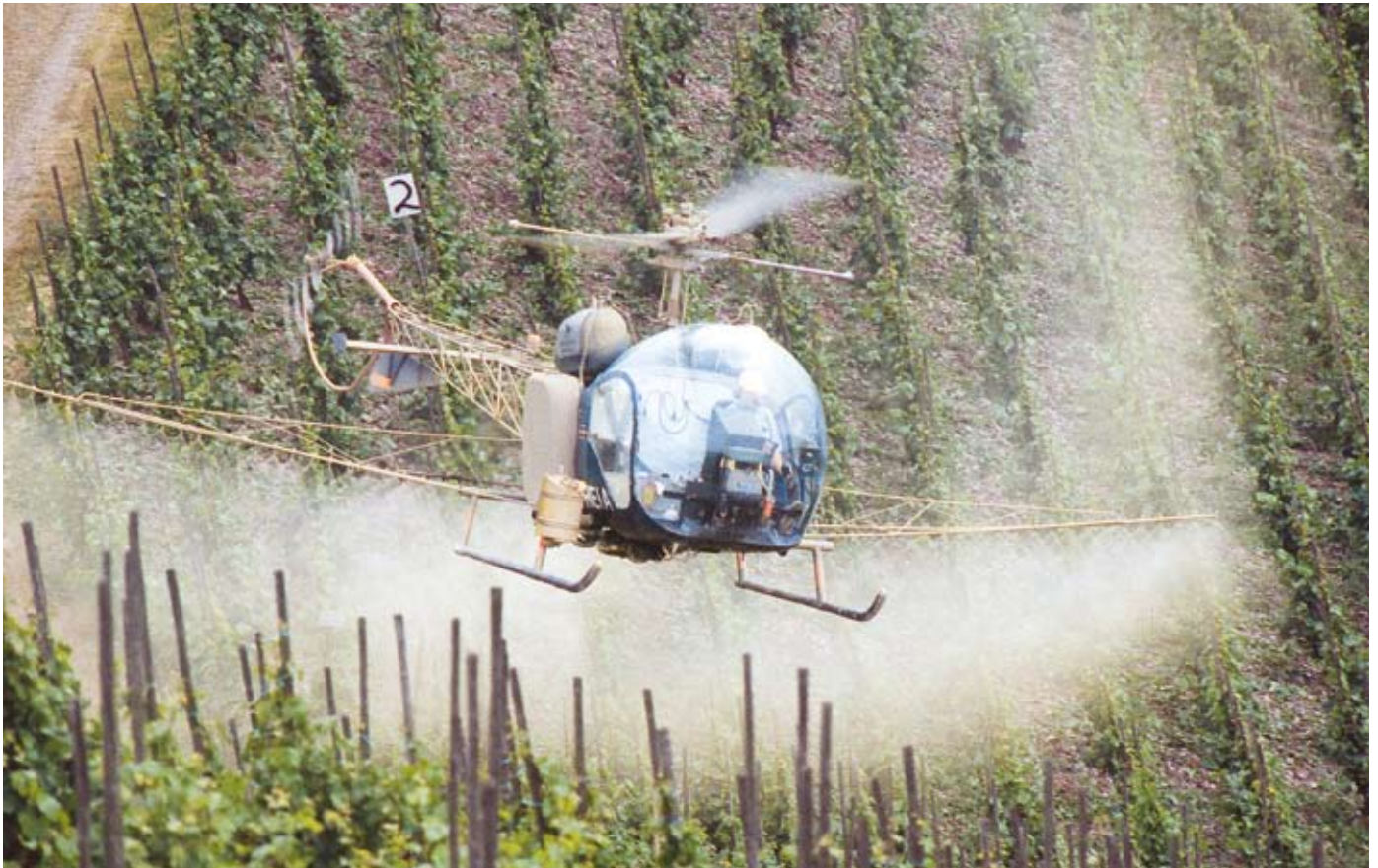
Auch über deutschen Weinbergen werden Pestizide aus der Luft versprüht.

Vitamine, Ballast- und Mineralstoffe machen Obst, Gemüse und Getreide zu besonders gesunden Lebensmitteln. Doch durch die intensive konventionelle Landwirtschaft landen unerwünschte Substanzen auf unserem Teller, die uns krank machen können. Vor allem Pestizide gefährden unsere Gesundheit – und ganz besonders die der Arbeiter auf Äckern und Plantagen.