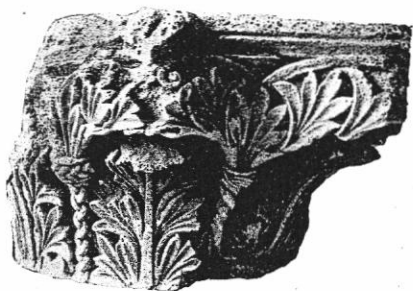
Oszlopfaj az eszteergomi bazilikából. (XI. század.)