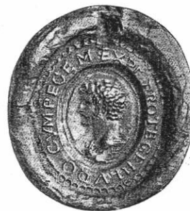
Német Lajos pecsétje.

Rasztiszlávot kétségkívül lehangolta, hogy a bizánci udvar segítségével sem jutott közelebb céljához, a morva tartományi egyház megalapításához. Amikor azután 864-ben Német Lajos haddal támadt reá és térdre kényszerült, 2 nem sokat habozott és felszámolt az egész bizánci kirándulással. Újra Rómától várta a bajor befolyás visszaszorítását. De amilyen mértékben közeledett Rómához, annál nehezebb helyzetbe jutott a két görög térítő udvarában. Ha megkezdett munkájuknak gyümölcsét akarták látni, nekik is valahogy ki kellett egyezniök Rómával. Elindultak tehát a római útra (867 eleje). Magukkal vitték Szent Kelemen földi maradványait, ezt a nagyértékű ereklyét, melyet Chersonban találtak fel. Ezzel az ajándékkal kívánták magukat és fejedelmük, Rasztiszláv kérését beajánlani. 3 A Szentszék épp ebben az időben ünnepelte a bolgár sikereket és miután nem kellett többé tartania a bajor udvartól, szívesen állt a szlávok pártjára. A Szentszék és a bajor udvar együttműködése egyszeriben felborult, felborult már akkor, amidőn Bolgárországban a római misszió a bajor térítőket egyszerűen hazakényszerítette. Most hát a római curia ismét felújította tervét Pannóniával, csak hogy még nagyobb arányokban. A dalmát partoktól egészen a morváig fog húzódni az új egyházterület a Szentszék