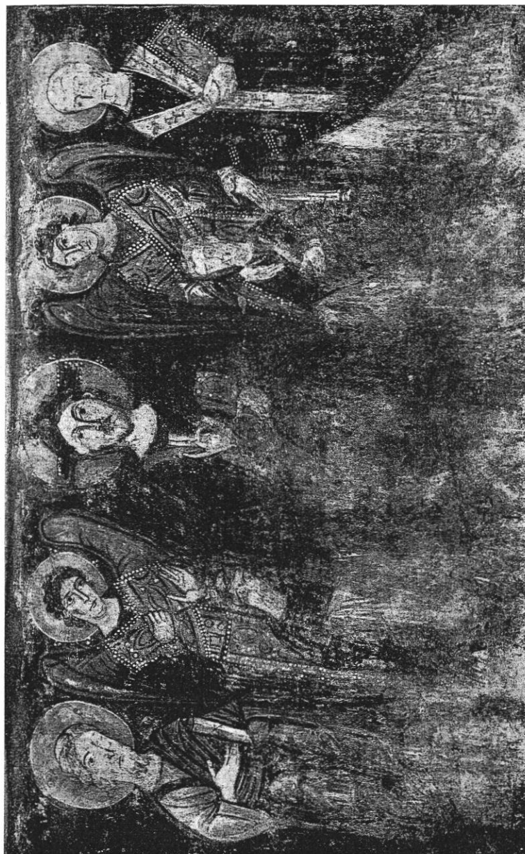
Cyryll Krisztus ítélőszéke előtt. Falfestmény Cyryll sirja felett a IX. századból. Róma, San Clemente-templom. Krisztus (a kép közepén) balján Cyryllt, jobbján Methodódot látjuk térdelőlni. A kép közvetlenül Cyryll halála után készült.