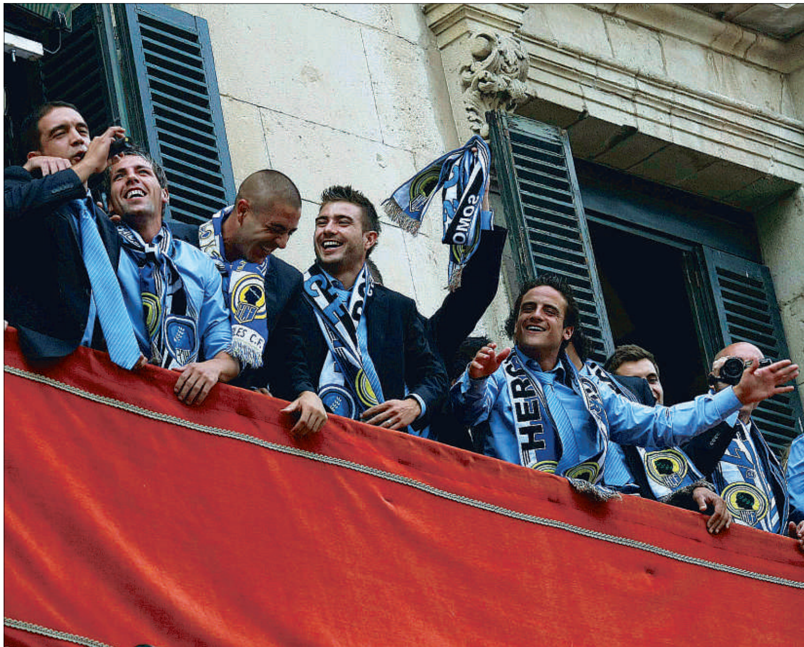
Con los más grandes Los jugadores del Hércules celebran la consecución del ascenso a Primera División