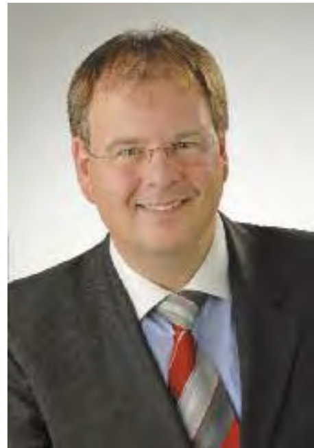
Wolfgang Panzer 1. Bürgermeister