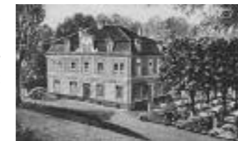
Ende der 1930er Jahre.