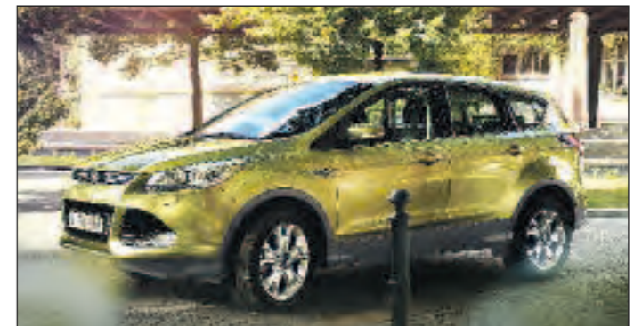
Abbildung zeigt Wunschausstattung gegen Mehrpreis.