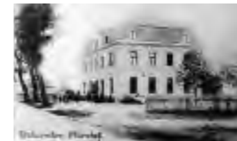
Restauration Marxhof 1903.

Notiz aus der Denkmalliste: Ehemalige Bahnhofsgaststätte, freistehender, zweigeschossiger Neurenaissancebau mit Mansarddach, um 1900.