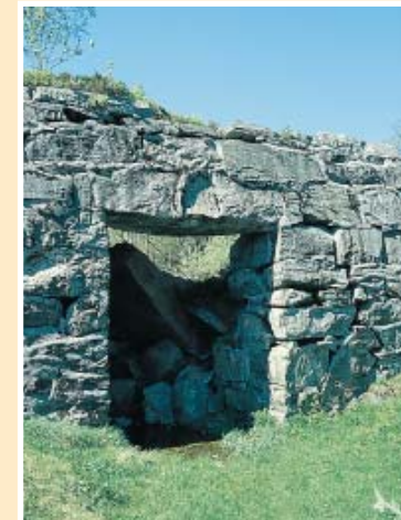
Ishus fra Langevatn