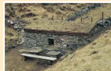
Flor i Melingen

«Den Trondhjemske postvei» fra Bergen og nordover gjennom Åsane ble bygget rundt 1800-tallet. Fra Bergen fulgte veien en gammel by- og bygdesti, der det var «indrettet nogle passable Stier og opført Broer over Elvene». Veien gikk 'over mange gyselige Kleve' slik at det var vanskelig å komme fram med hest. Men bøndene i Åsane var lite villige til å utbedre veien, ei heller gjøre det