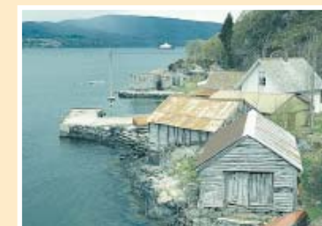
Postbryggen ved Tellevik