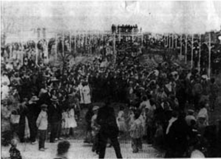
Inauguración del nuevo Jardín-Feria, con la Banda de Música ubicada en el templete central.1911.

El Jardín Feria tenía en el centro un templete o “tinglado para la música” 532 instalado el mismo año de su inauguración que en su parte inferior tenía un espacio destinado a café–restaurante. El Ayuntamiento sacó a subasta pública su explotación, comprometiéndose a que la Banda Municipal actuase regularmente o, en su defecto, que hubiera una rebaja en el precio del remate 533 , cosa que querían evitar a toda costa. La