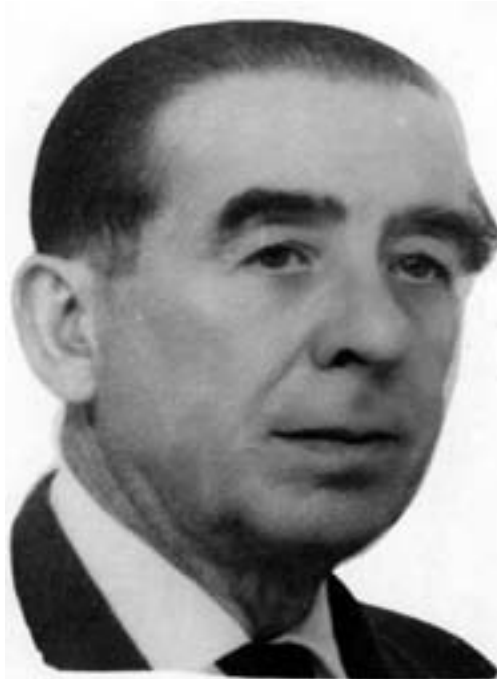
Leocadio Parras Collados, (Hellín, 1907–Madrid, 1973).