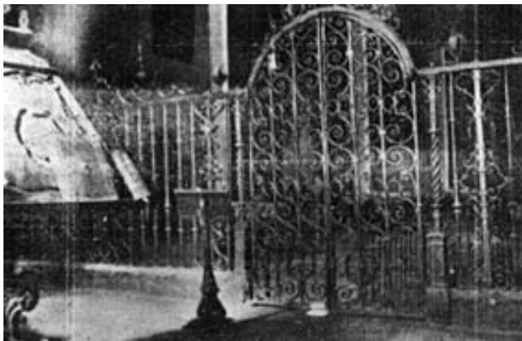
Única fotografía conservada del coro anterior a 1936, en la que se puede apreciar un fascistol y un atril así como la puerta cerrada y el arranque de la crujía.

Sin embargo esta ubicación no era la original, ya que cuando se construyó el órgano, en lugar del coro actual había una puerta al exterior 44 , y el coro estaba en medio de la nave principal, más próximo al Altar Mayor, y en un determinado momento se trasladó a su actual localización 45 .