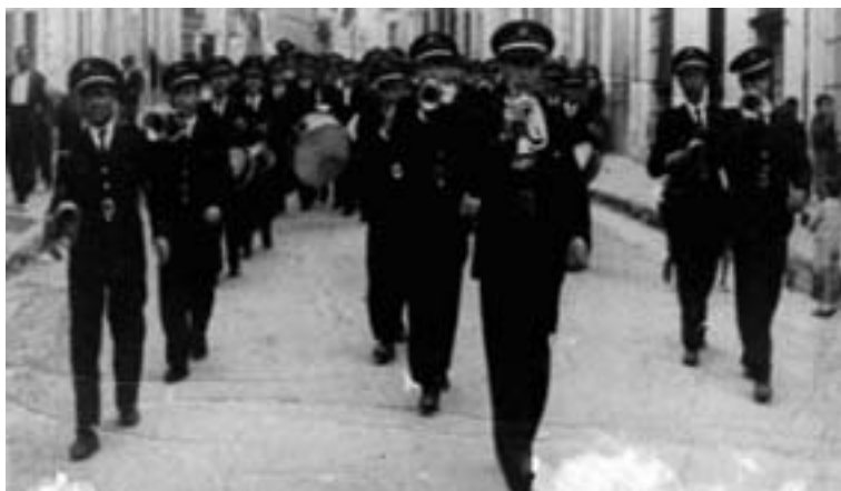
La Banda Municipal en la Feria de 1943, a su paso por la calle Juan Francisco Parras, con los nuevos uniformes azules.

solistas, 9 de primera, 9 de segunda, 10 de tercera y la sección de Cornetas y Tambores, –que ya era una seña de identidad de la Banda– con 7 cornetas y 6 tambores (cabos incluidos), pero ésta no correspondía exactamente con la plantilla real, que fue siempre algo más reducida. De esta manera era una institución municipal con músicos funcionarios a los que había que tener continuamente controlados con las inscripciones de altas y bajas de su trabajo en las academias y en los conciertos, tarea que estaba encomendada al director.