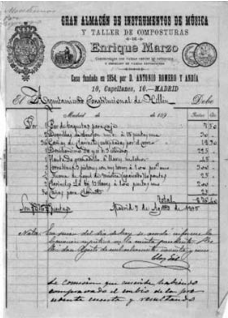
Factura de compra de instrumentos, 1895. (A.M.H., A 47)

haciéndose cargo de ellos y firmando un recibo acreditativo, de los que solo hay 2, fechados en agosto 439 .