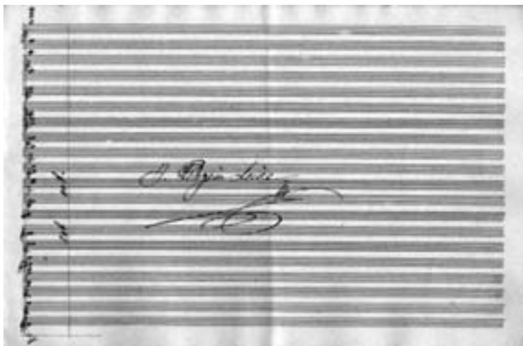
Orquestación de J.-P. Leive Márquez (3)