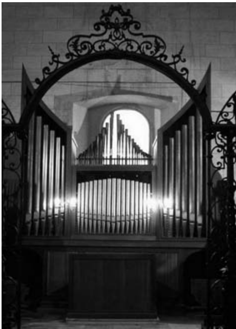
El órgano actual de la Parroquia de la Asunción de Hellín.

del puramente estético–, que cumplió la música en el interior de todos templos españoles durante tanto tiempo.