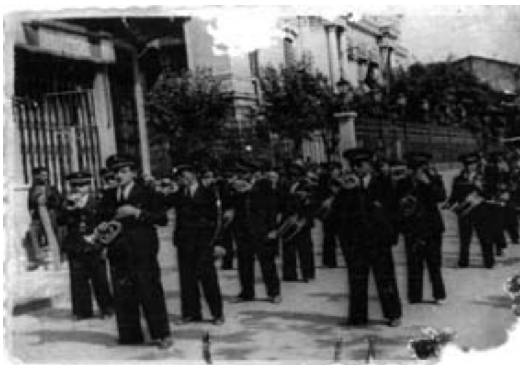
La Banda Municipal de Hellín, con la sección de Cornetas y Tambores en primer plano. Feria de Albacete de 1952.

a partir de 1950 924 . El Sábado de Pascua de 1951 tuvo lugar un concierto benéfico a cargo de la Orquesta de Cámara de Madrid 925 .