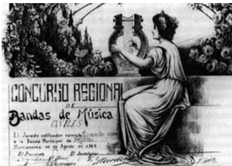
Diploma acreditativo del galardón obtenido en Manzanares. Original conservado en la actual Academia de la Unión Musical Santa Cecilia de Hellín.

después 692 , con lo que suponemos que se acabaría la discusión. El caso es que, después de mucho tiempo, la Banda Municipal de Hellín dio una gran alegría a sus fieles seguidores, y al pueblo en general que vibró con ellos y compartió los laureles del triunfo, ya que aunque se trataba de un segundo premio, se celebró como si hubieran sido los vencedores absolutos 693 .