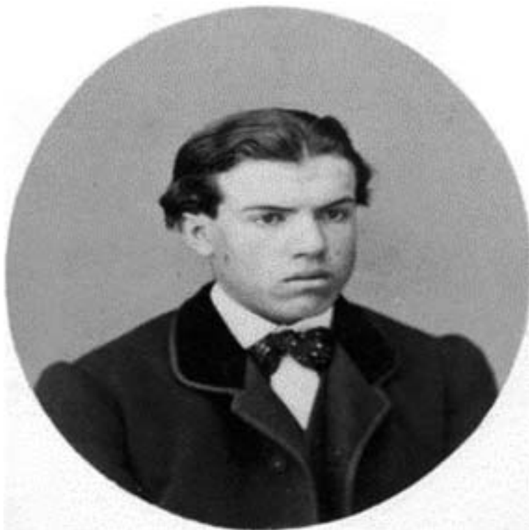
Antonio Mateos Negrillo (1857–1925).