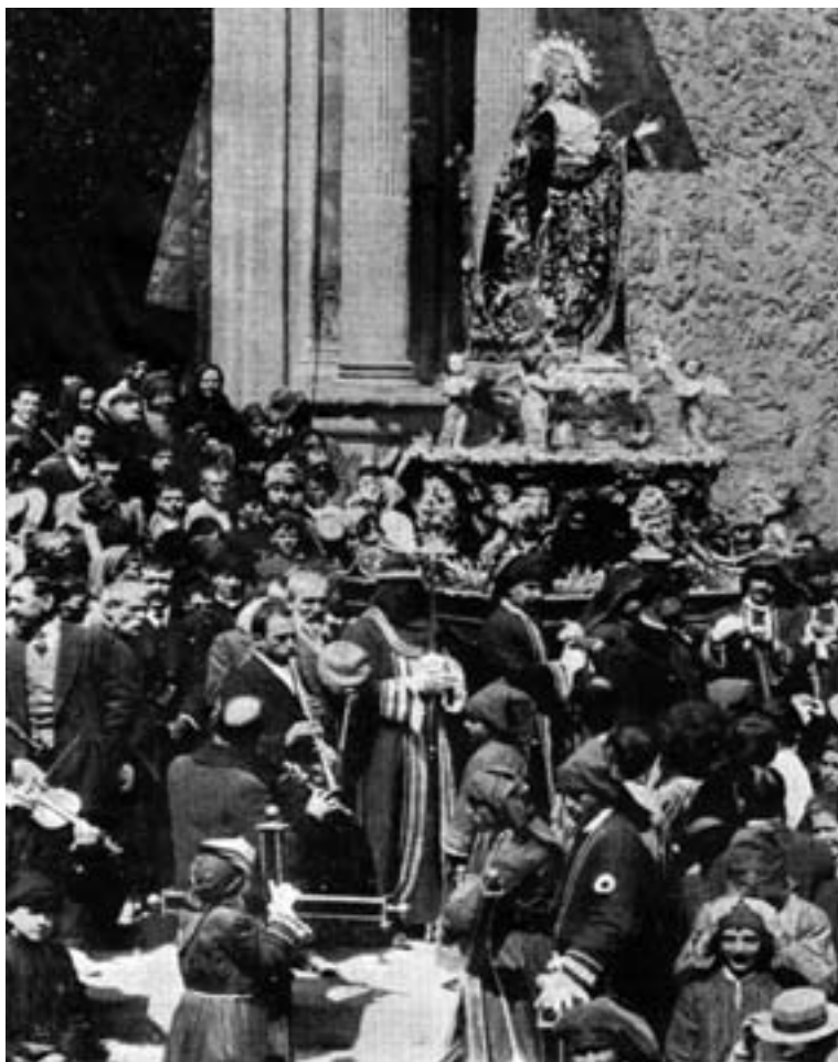
Alrededor de 1914. Violín, dos clarinetes y flauta travesera. (Foto publicada en El social de Hellín , 8-4-1914)