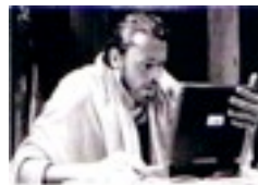
Exterminez toutes ces brutes brutes