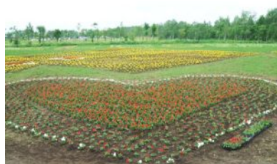
千歳「花の地上絵」プロジェクト