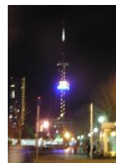
さっぽろテレビ塔 (消灯)