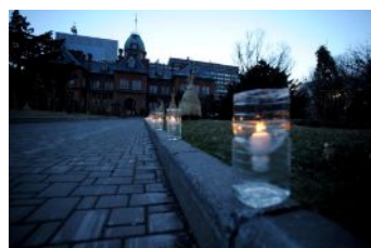
ガイアナイト in 赤れんが