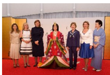
十二単着付けデモンストレーション(7/7)