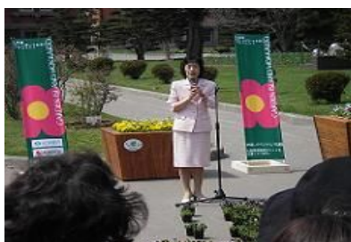
北海道花いっぱいでお迎えプロジェクト キックオフ(kick-off)セレモニー

道内企業から花観光地マップや花の種等の協賛をいただき、6月に開催された「北海道洞爺湖サミット総合環境展2008」では、花観光ブースを出展し、全道各地の花観光地のPRを行った。