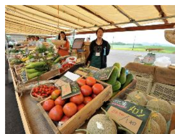
「北のまるしえ(物販ブース)」

留寿都村のルスツリゾートに「国際メディアセンター」が設置され、後志支庁管内が海外から大きな注目を浴びることも踏まえ、新鮮で高品質な地域の食材等を出展するイベントを市場(マルシェ)形式で開催し、後志の魅力の一つである「食」を中心に、海外プレスの方々を介してPRした。