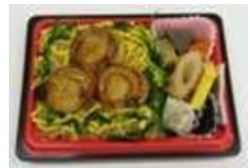
道産食材をふんだんに使用した 噴火湾産帆立弁当

環境配慮等：空容器等のリサイクルのほか、生育の早い竹を使った割箸の使用や、配送車両にバイオディーゼル燃料を使用するなど環境に配慮したほか、米は全て道産米を使用し、魚介や肉、野菜なども道産食材がふんだんに使用された。