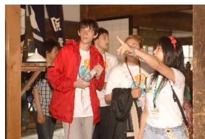
北海道開拓の村の視察

参加者：J8サミット参加者、J8コンテスト1次選考通過者（北海道内）、専門高校生環境サミット参加者、北海道高校生環境サミット参加者、こども環境サミット札幌参加者代表、千歳市中高生代表、イオンチアーズクラブメンバー 合計169名