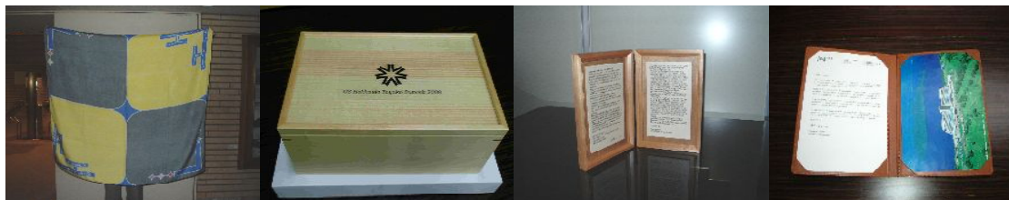
アイヌ文様の風呂敷