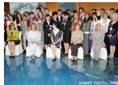
G8 首脳配偶者との交流(7/9)