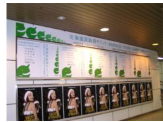
J R札幌駅コンコース