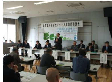
伊達市での地域住民懇話会 (H20. 6)