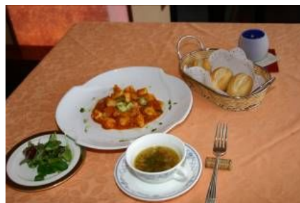
サミットメニューの一例

地域の食材にこだわったメニューを創作してきた後志支庁管内のレストラン等では、サミットの開催を契機に後志管内の食を発信していくため、地域の食材をメインとしたメニューを「サミット共通メニュー」を創作し、各レストランが連携して発進力を高め、地域の食材をPRした。