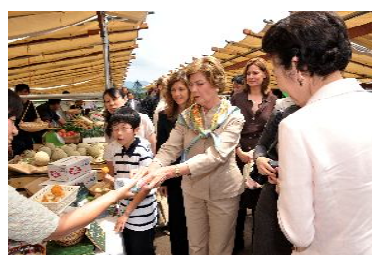
北のまるしえ視察(7/8)