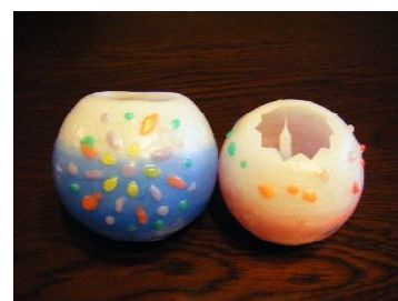
キャンドルアート道民会議会長賞 「花火(平和な空に願いをこめて)」