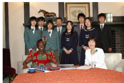
マータイ女史との記念写真

ノーベル平和賞受賞者で前ケニア環境副大臣のワンガリ・マータイ女史が6月3日に来道し、知事と対談を行った。対談は、北海道環境宣言で提唱する「地球を守る心」、「もったいない心」、「自然と共生する心」の3つの心を中心に、「環境との調和」をテーマに、J8コンテストに参加した道内高校生との意見交換も交えながら行った。