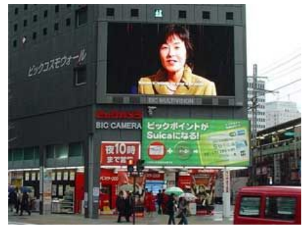
大型ビジョンでの動画CM

サミット関係者へのおもてなしの気持ちを伝えるとともに、北海道の環境、観光の魅力のPRと来道呼びかけの動画CM（おもてなし編・観光編・環境編、各30秒）を平成20年2月に作成し、道民会議ポータルサイトや関連行事、航空機内や企業店舗の大型ビジョンなどで放映した。