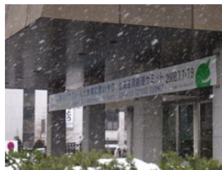
札幌市役所南側玄関