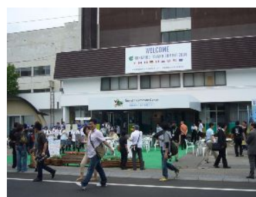
来場者で賑わう「ふれあい情報TOWN」

国内外から訪れるサミット関係者を歓迎し、暖かくおもてなしするため、洞爺湖温泉街に「洞爺湖ふれあい情報TOWN」が設置された。