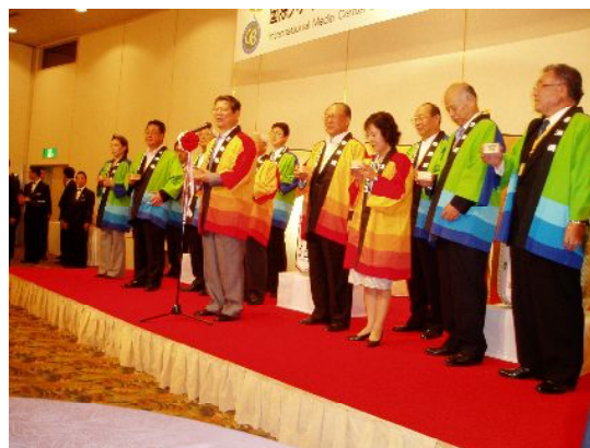
開所記念レセプションでの挨拶