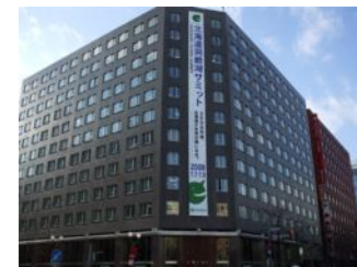
北海道銀行本店ビル