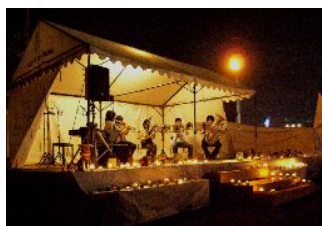
ガイアナイトフェスタ in そらち