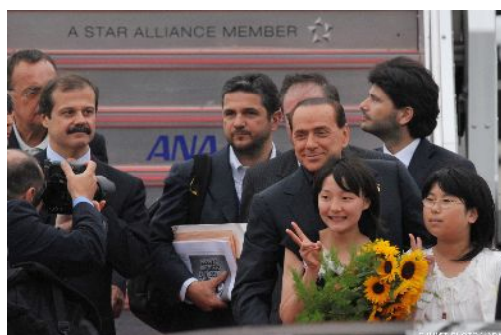
ベルルスコーニ・イタリア首相到着(7/6)