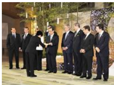
「千歳宣言」、「J8アクションプラン」のG8首脳への提出(7/7)