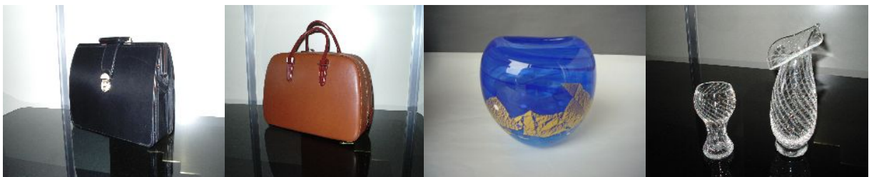
G8首脳ご夫妻（紳士用）

これらの贈呈品は、アイヌ文様の風呂敷や置戸で作製された木製ギフト箱で梱包したほか、置戸で作製された木製フレーム及び赤平の企業作製の革製フレームで装飾したウェルカム・メッセージを添えるなど、北海道製品の世界にむけた情報発信を行った。