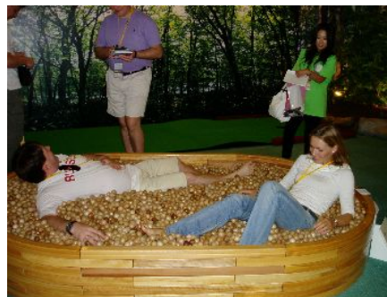
森のゾーン(木のボールプール)