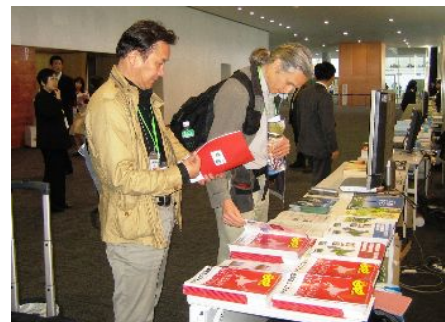
労働大臣会合での北海道ブース

サミットに先立って開催されたG8閣僚会合を取材する国内外のプレスに対し、北海道洞爺湖サミットと北海道の魅力をPRするため、関係省庁及び地元関係者の協力を得て、各会合のプレスセンター内等に特設ブースを設置し、道民会議公式ポスターや卓上のぼりの掲出等を行うとともに、北海道情報誌、サミット啓発リーフレットやYokoso! HOKKAIDO PASS 広報チラシの配布など、多彩な広報活動を実施した。