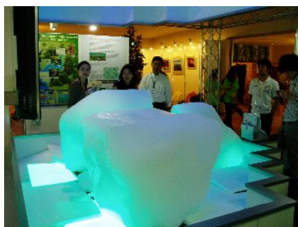
海のゾーン(流氷の現物展示)