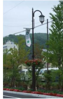
洞爺湖町 歓迎バナー