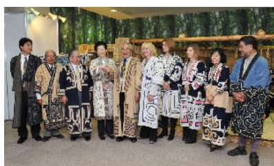
北海道情報館視察(7/8)