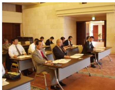
道外視察（沖縄・万国津梁館） における説明聴取

なお、サミット開催期間中には、IMC及び北海道情報館開所記念レセプション及び2回のアウトリーチ国・国際機関歓迎レセプションに、委員会として出席した。