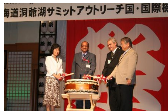
各国代表と知事、札幌市長による檣点灯式

概 要：「北海道の夏・祭り」をコンセプトに、各国代表団による檣点灯、来道を記念したミスさっぽろから各国代表団への花束贈呈のほか、太鼓や北海盆踊りの披露も行った。