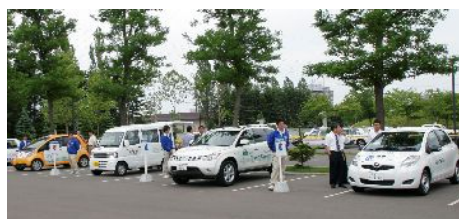
屋外会場でのエコカー展示・体験試乗

燃料電池自動車、クリーンディーゼル自動車など19台の環境対応車の展示・試乗等を実施した。