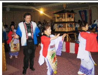
三笠盆踊りで地域の方と交流する海外プレス(第4回)