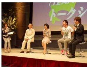
ガイアナイト・イベント in Tokyo