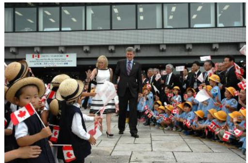
伊達市を訪れたハーパー首相夫妻

平成20年7月7日、ハーパー・カナダ首相夫妻がカナダ・レイクカウチン町と姉妹提携20周年を迎える伊達市を訪問し、交流が行われた。首相夫妻は、知事、伊達市長夫妻、地元の幼稚園児の手旗や青少年による和太鼓演奏等により盛大に出迎えられた後、伊達市とレイクカウチン町の学生による「子ども環境サミット」に参加した。