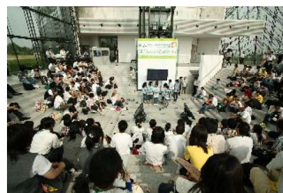
モエレ沼公園での意見交換