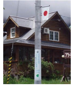
倶知安町内 北電電柱歓迎バナー