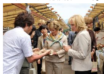
北のまるしえを訪れた首脳配偶者