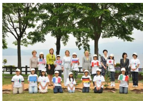
首脳配偶者による植樹