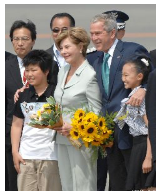
ブッシュ・アメリカ大統領到着(7/6)