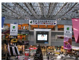
新千歳空港ターミナルビル 2階センタープラザ