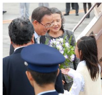
潘・国連事務総長到着(7/7)