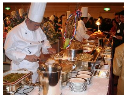
道産食材をふんだんに使用した数々の料理