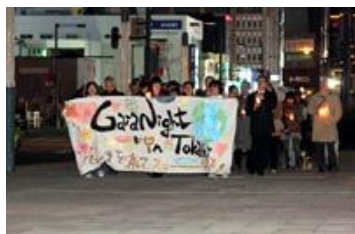
ガイアナイト イン とから