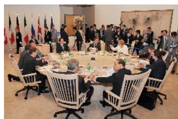
G8ワーキングセッション(7/8)