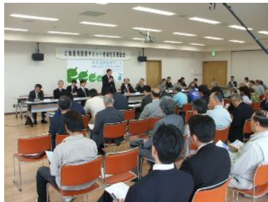
洞爺湖町での地域住民懇話会 (H20. 6)

サミットに関する情報を地元関係団体・住民に提供し、サミット開催に対する理解促進と歓迎機運を醸成するとともに、住民等が有する疑問や課題を聴き、その解決の促進によりサミットの円滑な開催に資することを目的に「北海道洞爺湖サミットに関する地域住民懇話会」を道及び関係市町村（洞爺湖町、壮瞥町、豊浦町、留寿都村、伊達市、登別市、真狩村、ニセコ町）の共催により、外務省及び関係省庁の協力を得ながら開催した。合計13回の開催で、606名の住民等が参加し、サミット開催による農業、漁業など産業活動や住民生活への影響、警備、交通規制や通信インフラ整備などについて質疑があり、サミットの円滑な開催に向けた環境づくりを行った。