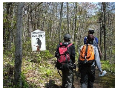
フットパスコースを歩く旅行者

北海道の豊かな自然環境でのおもてなしの一環として、サミット開催前・期間中に洞爺湖周辺地域を訪れるプレス関係者も含む国内外のサミット関係者の利用を促進するために、西胆振地域1市3町で「フットパス・エコツーリズム振興実行委員会」を設立し、国関係機関、北海道経済連合会、北海道観光振興機構、道民会議などと連携しながら、洞爺湖周辺地域をモデル地域として、北海道フットパスの振興に取り組むこととした。