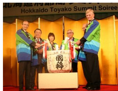
来賓らによる鏡開き

道内の色鮮やかな花卉に彩られた会場にお集まりいただいた約450人の出席者には、多くの企業・団体からご協力をいただいた道産食材をふんだんに使った食事や道産のお酒、スイーツを提供し、北海道の民謡や道産木材でつくられたパイプオルガンの演奏も行った。この他、道内の観光、アイヌ文化紹介等のパネルや自然をテーマにした写真を多数展示する等、北海道のPRに努めた。