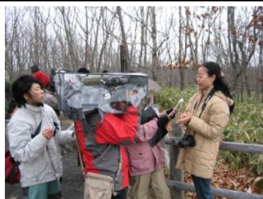
釧路湿原を取材する海外プレス(第1回)