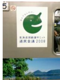
J R 快速エアポート