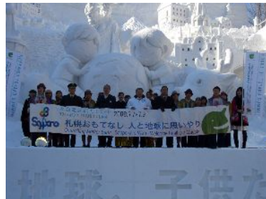
さっぽろ雪まつり(サミット・観光振興PRブース) さっぽろ雪まつり(サミットステージでののぼり活用)