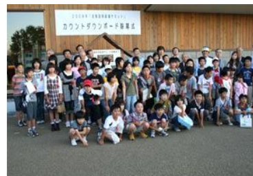
カウントダウンボード除幕式後の記念写真