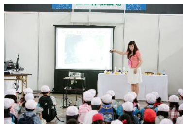
子ども達で賑わうエコ体験広場