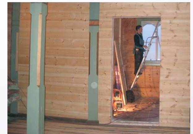
Her ser me inn i det nye barnerommet som er plassert bak i hjørnet, under galleriet.