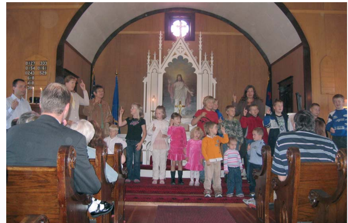
Søndagsskulens dag i Emigrantkyrkja 24. september. Hugs at ingen er fødde med kristen tru og kunnskap. Den glade budskapen må me alle ta ansvar for å vidareformidla. Takk til alle søndagsskulelærarar som står klare til å ta i mot borna våre og dela Guds ord med dei.

Illustrasjon: Svein Nyhus / Grønn Hverdag