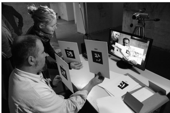
Magányos és társas művek 2.0 című kiállítás a Magma-ban. Sepsiszentgyörgy, 2013

– A Könyvtárban a könyvtármúzeumi anyagok terén az Alice 5.50 alatt épített új katalógus bőven meghaladta a 35 000 tételt. Ebből 7640 tétel (zömmel régikönyv) minimális adatai on-line kereséssel is hozzáférhetőek a múzeum honlapján. Nyilvántartásba került a teljes Kádár Zsombor-hagyaték.