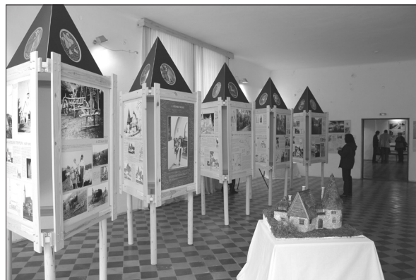
Kós Károly világa, 1912 című kiállítás. Sepsiszentgyörgy, 2013