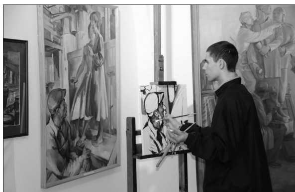
Középiskolás diák résztvevő a Festészet Napján . Sepsiszentgyörgy, 2013

rajzi Múzeum évkönyvében Surse maghiare despre meșteșuguri brașovene címmel. Ismertetője: A néprajzi gyűjtemények, in: Kinda István (szerk.): A Székely Nemzeti Múzeum , második, javított és bővített kiadás, Sepsiszentgyörgy, 2013, 45–54.