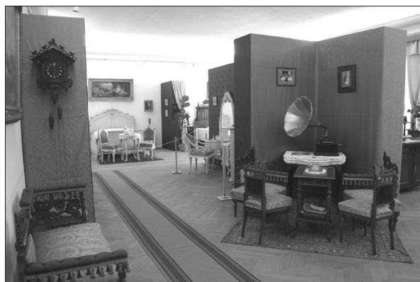
Békebeli otthonok. Polgári lakáskultúra Háromszéken. Kézdivásárhely, 2012

A baróti erdővidék Múzeuma mintegy 70 eseményt szervezett az elmúlt időszakban, melyek közt számos előadás, több kiállítás, filmvetítés és gyermekprogram szerepelt.