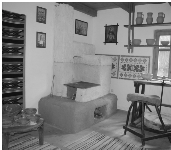
A gorzafalvi kerámia. Zabolá, 2012