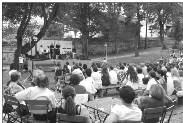
Múzeumkerti koncertek sorozat. Sepsiszentgyörgy, 2012