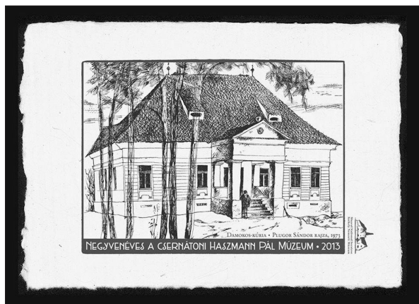
40 éves a Haszmann Pál Múzeum. Csernáton, 2013

Az Erdélyi Művészeti Központ 2013. február–március folyamán Kolozsváron a Minerva kiállítóterben és a bukaresti Balassi Intézetben tartotta bemutatkozó tárlatait. Szeptemberben Sepsiszentgyörgyön nyílt meg a Szocrelatív. Erdélyi magyar művészet 1945–1965 című nagy sikerű kiállítás Vécsei Nagy Zoltán kurátor irányítása alatt, s ugyancsak ezen az eseményen mutatták be a kurátor által írt, a kiállítással azonos című kötetet.