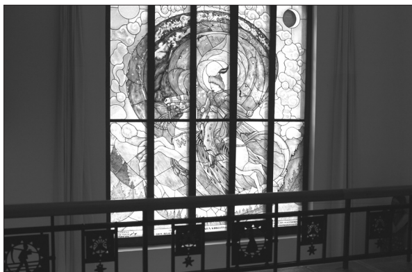
Csaba királyfi, üvegfestmény. Sepsiszentgyörgy, 2012

vékenységét és 2016 áprilisáig újabb négy évre megbízást adott számára.