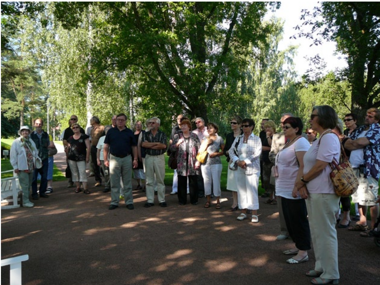
ja tarkkaavainen kuulijakunta