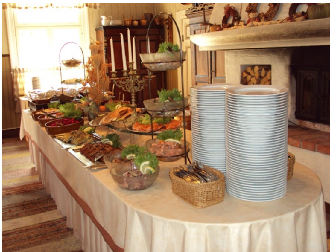
Pohjankulman saaristolaispöydän antimia