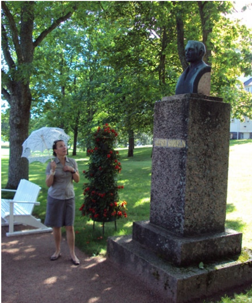
Kultarannan kierros alkamassa. Opas, pitsinen päivänvarjo, Kordelinin patsas