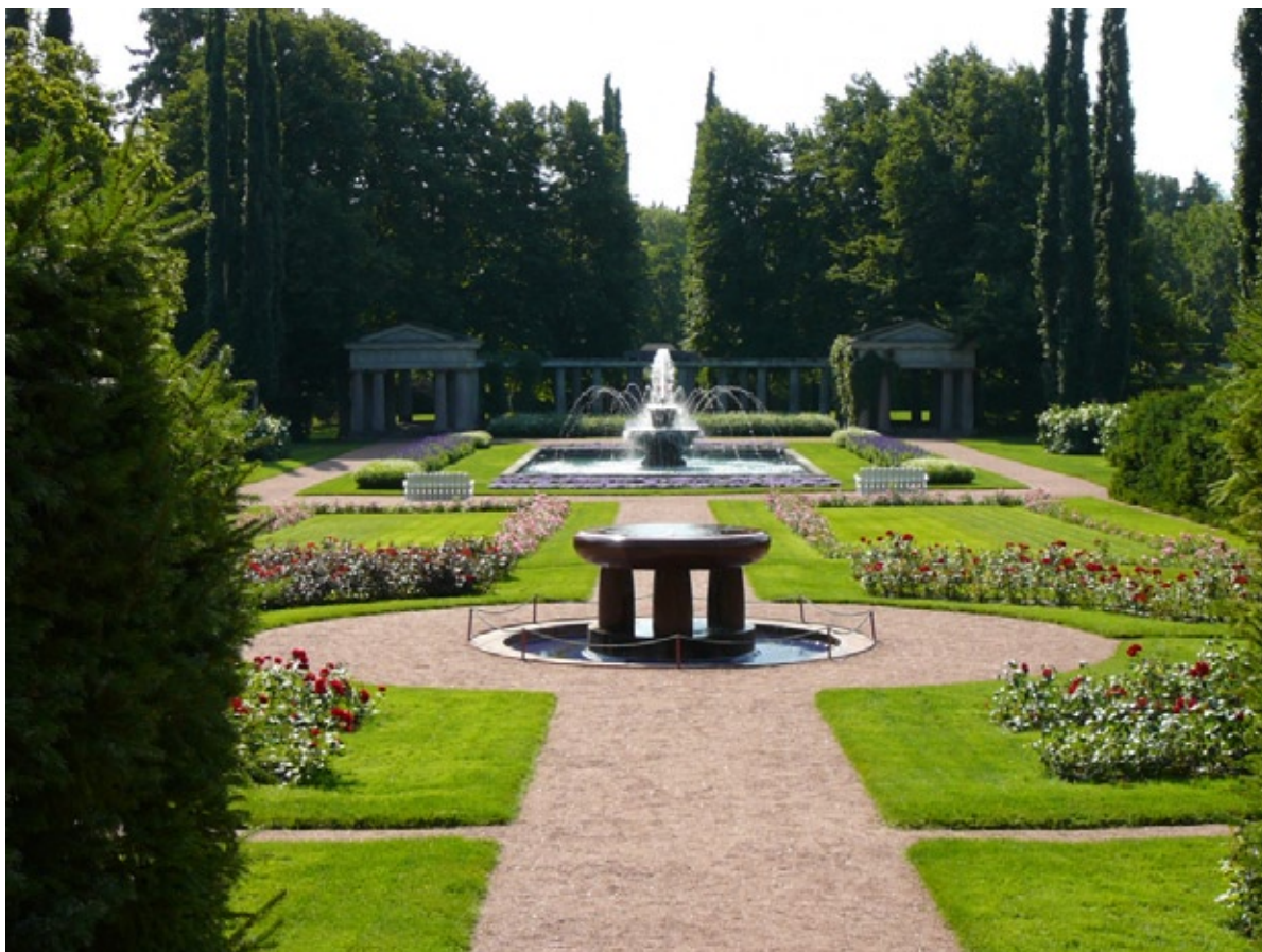
Kukkaistutuksia, suihkulähteitä ja aurinkokello