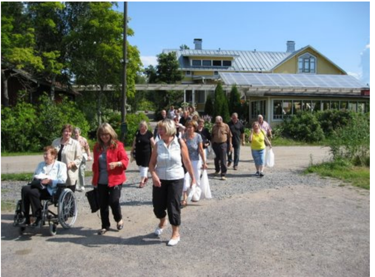
Ruokailun jälkeen paluu bussille. Rymättylän opas punaisessa takissa