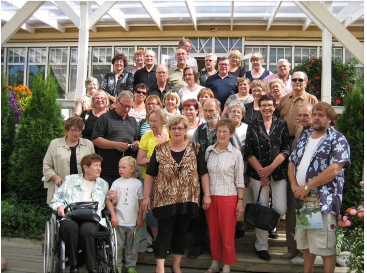
Ryhmäkuva Pohjankulman rappusilla