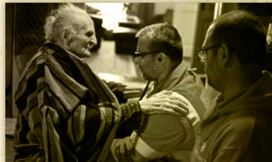
a fotóművész egyik kedvenc képe

Tavaly 2011 szeptember 17-én a szemem láttára a férjemet elütötte egy személyautó biciklizés közben. Itt életemben első alkalommal kerültem kapcsolatba a Mentőszolgálattal. A 'helyi' esetkocsi személyzete a veszprémi kórház traumatológiájára szállította a férjemet. A fotók a Magyarországon szolgáló mentőkről készültek. Emberfeletti munkájukról, ahogy igen mostoha körülmények és feltételek között, a legnagyobb tudásunknak megfelelően életet mentenek, sérülteket látnak el.