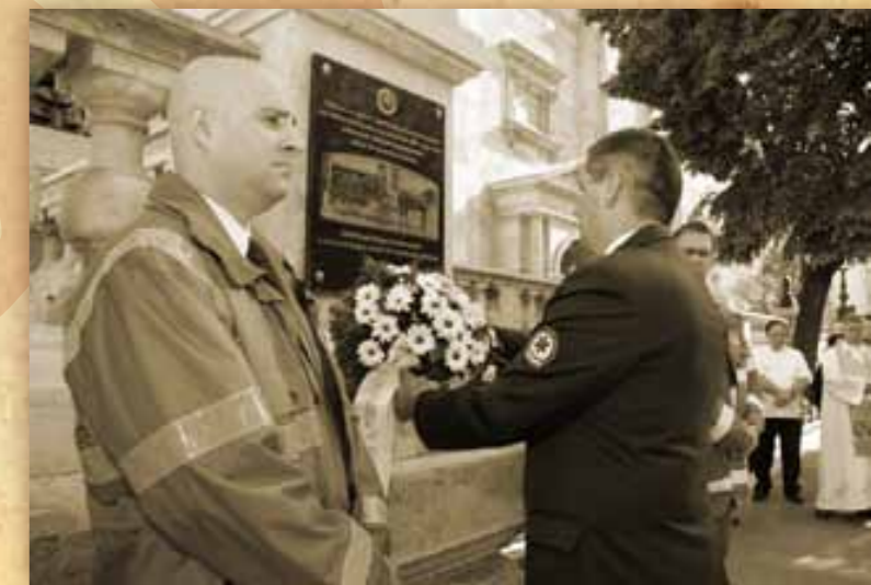
emléktábla avatás a budapesti Szent István Bazilikánál