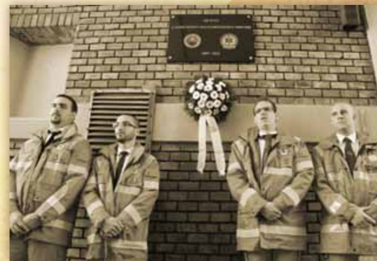
emléktábla avatás a Mentőpalotánál