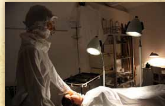
Életképek a műtőből, korabeli eszközökkel és berendezésekkel