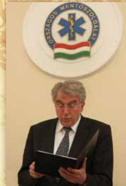
Dr. Rétbelyi Miklós Nemzeti Erőforrás miniszter nyitotta meg a kiállítást