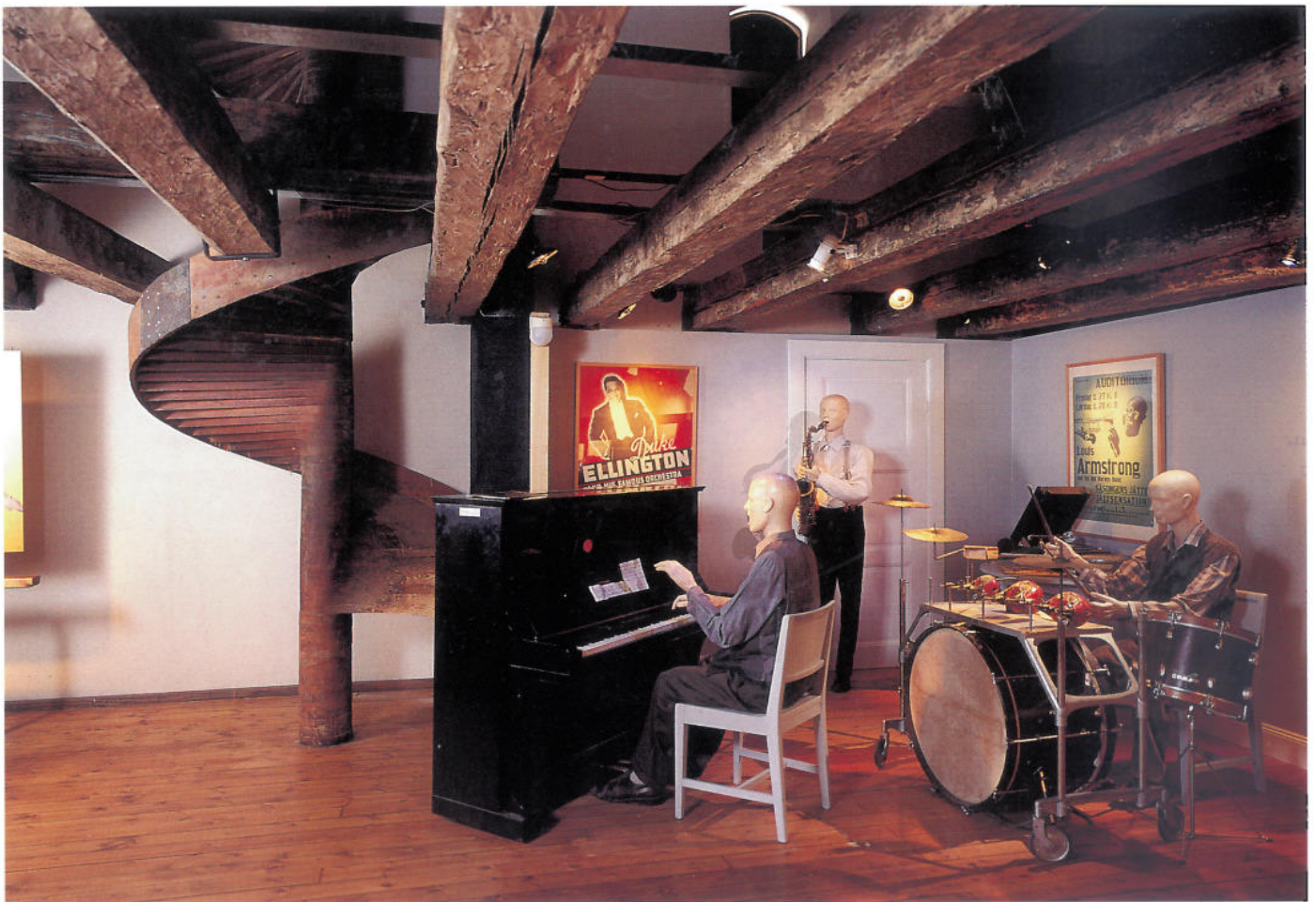
Få detaljer i interiören minner i dag om bageriets 300-åriga historia. I en av utställningssalarna har dock en träutschbana för mjölsäckar bevarats till våra dagar.

gare putslager blev åter synliga. I samband med renoveringen tillkom också porten på sydgaveln i ålderdomlig stil.