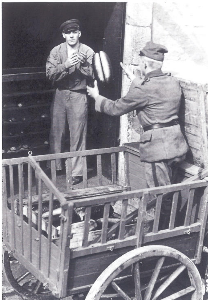
Då den sista brödkakan togs ur ugnen på Kronobageriet 1958 hade delar av byggnaden använts som bageri i mer än 300 år. Interiörerna från 1920-talet visar hur elektriskt ljus och maskiner kom att underlätta verksamheten under bageriets sista halvsekel.

äro nödiga». Krigskollegiet sänder därför en «vänlig begäran» till Fortifikationsdepartementet att «en annan öppning med snaraste mätte göras».