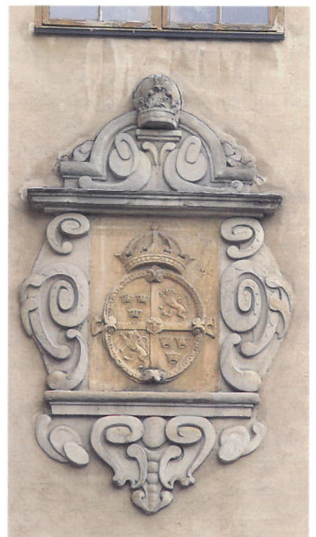
Vapenkartuschen med Johan III:s valspråk «Gud vår beskyddare» och årtal 1580 har bidragit till mytfloran kring Kronobageriet.

Vapenkartuschen med årtal 1580 över ingången till provianthuset kan mycket väl höra samman med överflyttningen av arkliet från slottet. Det är ingen orimlig tanke att den en gång satt i anslutning till den port som ledde in till arkliet på slottet Tre kronor och att den togs med då vapenförrådet fördes över till nya lokaler. Johan III:s valspråk, «Gud vår beskyddare», bör ha varit en väl motiverad devis över porten till arkliet.