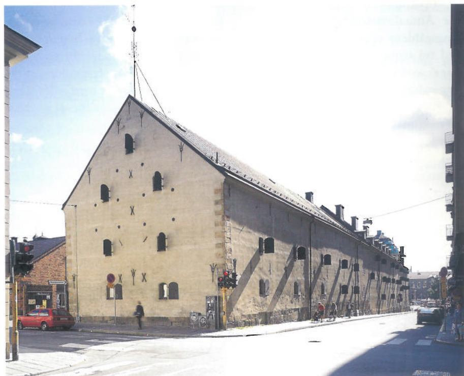
Kronobageriet från nordväst 1998. Hörnkedjorna av sandsten förekommer bara på den norra av de tre byggnadsdelarna. Ankarlutarna av krontyp visar att byggnaden var Kronans egendom. Liknande ankarlutur finns exempelvis på Drabanthusen, 'Långa raden', på Skeppsholmen.

I de skriftliga källorna hittar man ett beslut från 1639 som visar att Amiralitetskollegiet ska börja spränga för en fastagekällare i Kungsgården. Fastage var en samlande benämning på stora laggkär, tunnor och fat för förvaring av både färskvatten och proviant. Från påföljande år finns andra dokument som bland annat nämner virket till sparrarna för «provianthusen över källaren». I skrivelser från Amiralitetskollegiet till Kungl. Maj:t 1646 talas det om «den nya källaren och provianthuset som nu står halvbyggt» och fem år senare skriver Amiralitetet till befälningssmannen på Åland efter tegel till «det halvbyggda stenhuset i Kungsgården, som till amiralitetsmagasin och provianthus ärnat är». När källorna talar om provianthuset som halvbyggt är det inte säkert att man avser att murarna bara var uppförda till halva sin höjd. Det är snarare troligt att man avsåg att huset bara var uppfört till halva sin längd. Det utanpåliggande trapphuset, som på 1600-talskartan är markerat intill provianthusets sydöstra