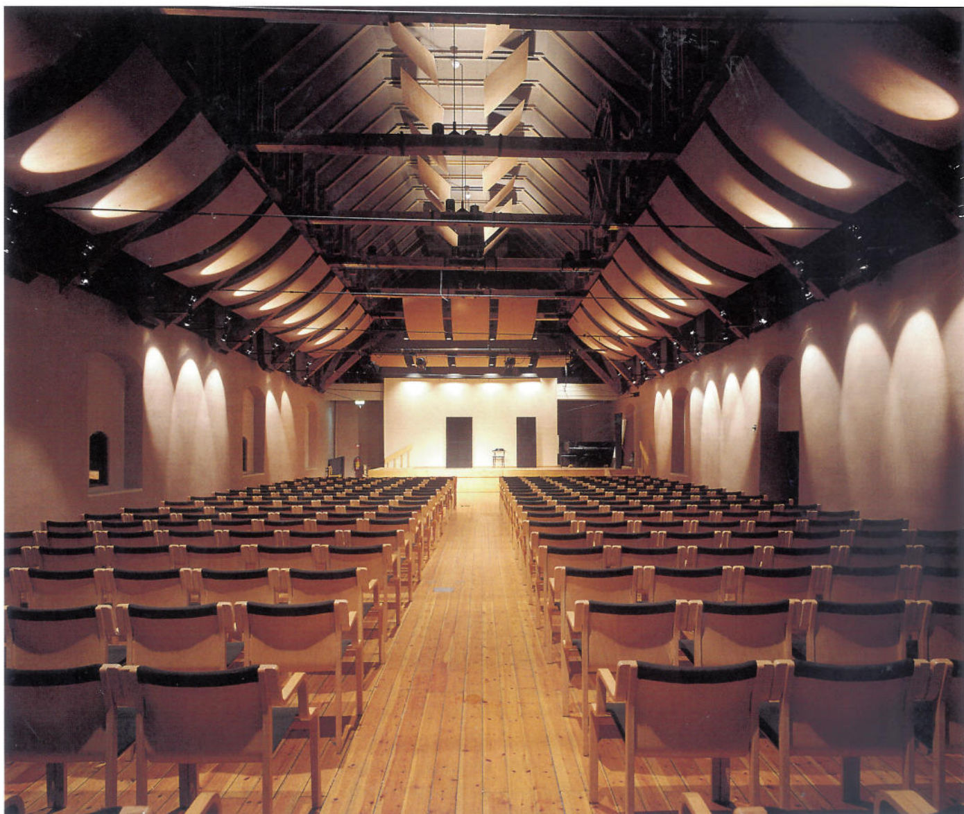
År 1848 byggdes norra delen av huset om för Svea artilleriregemente. Här inreddes kök, matsal och gymnastiksal. I gymnastiksalen spelades även amatörteater under en period på 1860-talet. I dag är artilleristernas forna gymnastiksal Musikmuseets stora konsertsal.

Provianthuset hade stått tomt sedan Amiralitetet flyttat från Stockholm men i södra huset, bagerihuset, satt fortfarande den gamla amiralitetsbageren Petter Lorentz kvar. Trots sin bittera klagan måste han 1699 slutligen flytta därifrån då eldningen i bageriet innebar stor brandfara för arklihuset. Förutom bageriet inrymde huset sannolikt även hans bostad. Av hans klagoskrivelser framgår att det var mer än 60 alnar mellan bageriet och provianthuset och att området mellan husen då ännu inte var bebyggt.