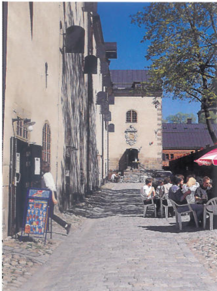
På Musikmuseets gård finns sommartid en kaffeservering.

hörn, var av allt att döma tänkt att ligga mitt på långsidan av huset som förmodligen var avsett att bli dubbelt så långt. Vid den byggnadsantikvariska undersökningen visade det sig också att det redan från början funnits dörröppningar i provianthusets mur som öppnat sig mot en planerad förlängning. Oavslutade bitar av murverk sträcker sig också in på mitthusets tomt från både södra och norra huset.