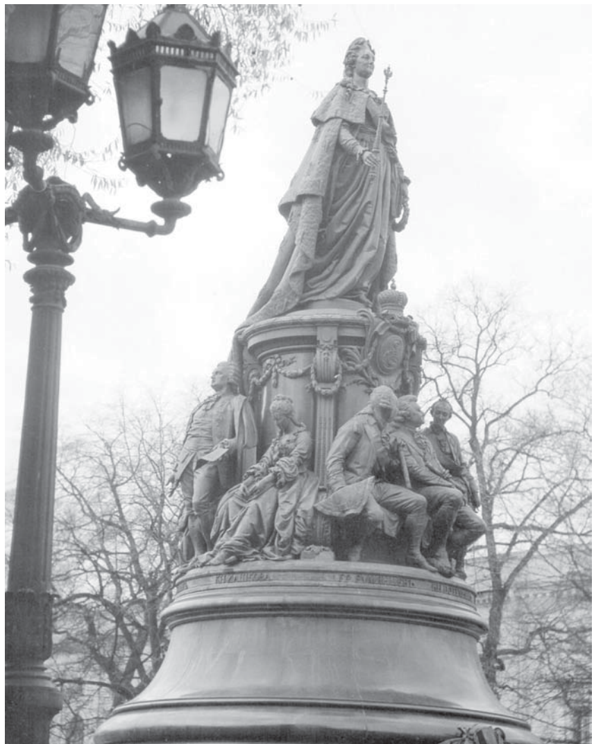
Памятник Екатерине II. Скульптор М. О. Микешин, архитекторы Д. И. Grimm и В. А. Шретер

А ведь Гастроном № 1, как тогда назывался знаменитый Елисейский магазин, снабжался, по сравнению с другими магазинами, неплохо. Не зря в уста Екатерины II, что памятником стоит на противоположной стороне Невского проспекта в Екатерининском сквере, остроумные ленинградцы вложили всего две убийственные строчки: