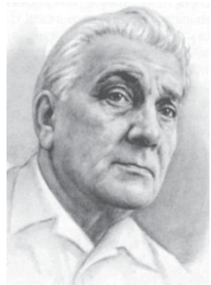
Народный артист СССР Н. К. Симонов

«Дома Гришки Распутина» на Горюховой улице, 64.