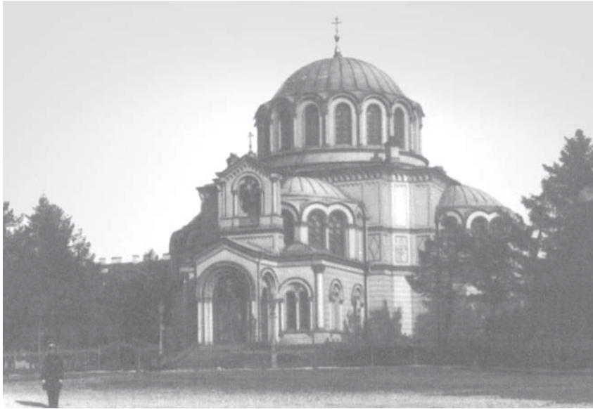
Греческая церковь Св. великомученика Димитрия Солунского. Фото 1900-х гг.

Другая, сентиментальная, в полном соответствии с традициями соцреализма, легенда рассказывает о простом советском человеке, который, гуляя однажды по набережной Невы, захотел зайти в ресторан. В ресторан его не пустили и даже довольно грубо обошлись с ним, и он, оскорбленный в лучших своих чувствах, бросился в ближайший райком партии. Справедливость восторжествовала. К плавучке «подошли милицейские катера и буксиры, ресторан вместе с посетителями и администрацией вывели в залив, оттащили к Лахте, вышвырнули на мелководье, заставив несчастных по пояс в воде брести к топкому берегу». Наутро явился ОБХСС и устроил грандиозную проверку. Вся администрация была арестована.