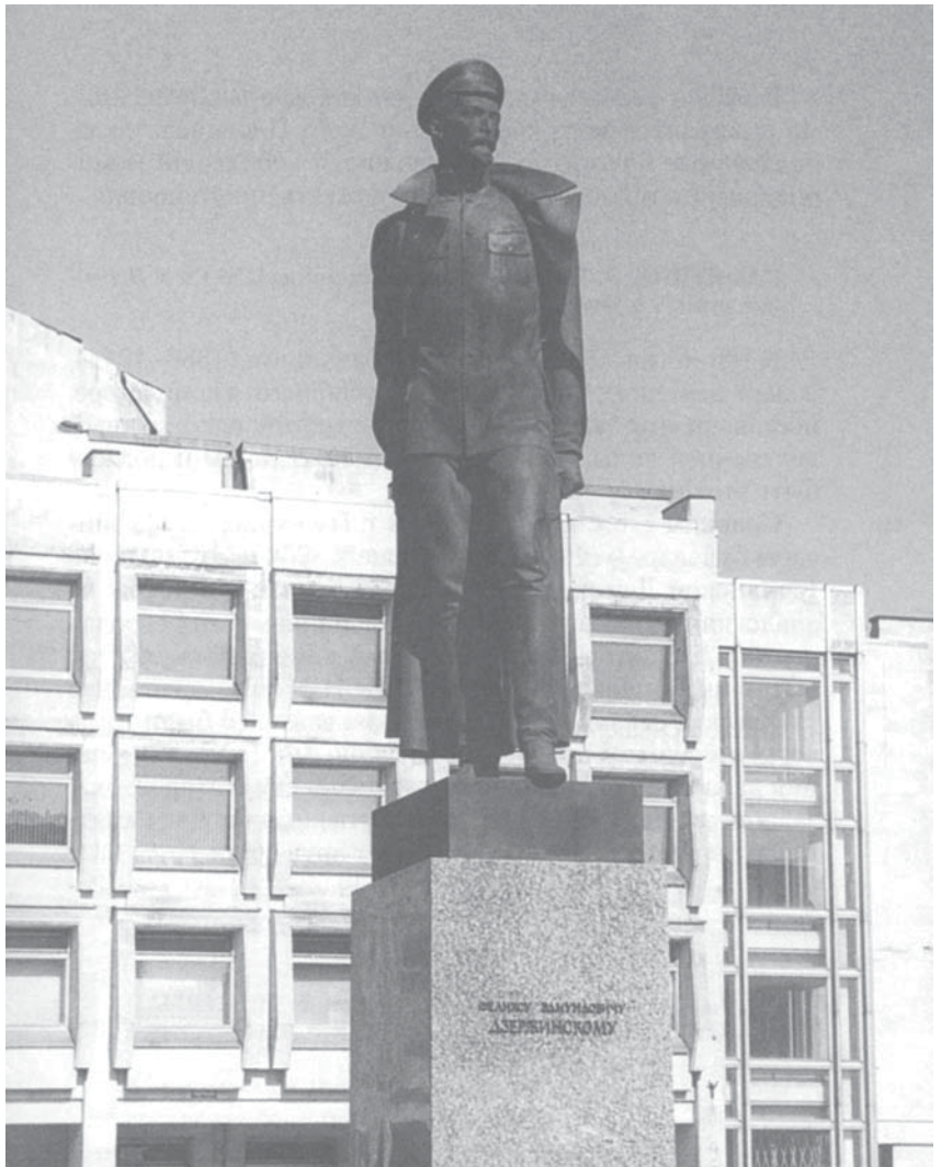
Памятник Ф. Э. Дзержинскому, открытый в 1981 г.

О петербургском городском фольклоре будущего пятидесятилетия нашей истории, надо надеяться, расскажут на страницах этого журнала уже другие.