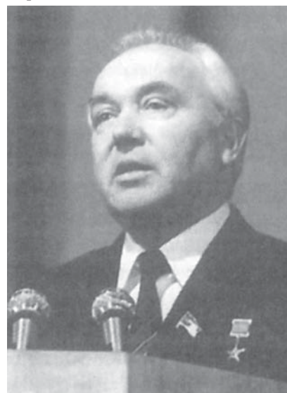
Первый секретарь Ленинградского обкома КПСС Г. В. Романов

В 1970 году карьера Толстикова в Ленинграде неожиданно оборвалась. Он был назначен чрезвычайным и полномочным послом в Китайскую Народную Республику. Говорят, в чем-то провинился перед Москвой.