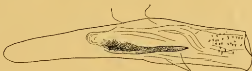
Abb. 9. Aedoeagus von Synaphe bombycalis (Schiff.). Präparat Nr. M. 995 (Steinfeld bei Wien).

Der Aedoeagus (Abb. 9) mit einem aus kleinen Chitinzähnen bestehenden Cuneus und einem langen Cornutus. Die Basalskulptur des letzteren nimmt einen großen Teil ein.