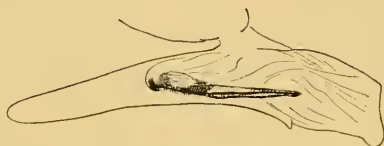
Abb. 4 Aedoeagus von Synaphe aberralis (Gn.). Präparat Nr. M. 994 (Xauen).

Die Genitalunterschiede der moldavica gegenüber sprechen zugunsten einer artlichen Unabhängigkeit der aberralis . Der Aedoeagus (Abb. 4) ist im allgemeinen merklich schlanker mit einem schmalen Coecum penis. Der Cornutus ist auch schmaler, an der Distalspitze abgestumpft; seine proximale Skulptur ist nicht so stark ausgedehnt wie bei moldavica .