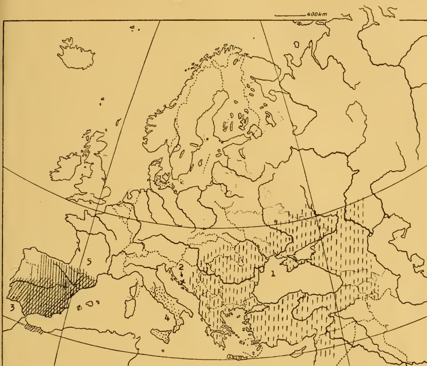
Abb. 1 Verbreitung der Arten der moldavica -Gruppe. 1 (senkrechte unterbrochene Streifung) — Synaphe moldavica (Esp.); 2 (Kreuzzeichen) — S. schmidti (Hrtg.); 3 (schräge Streifung) — S. aberralis (Gn.); 4 (Punktierung) — S. netricalis (Hb.); 5 (senkrechte Streifung) — S. diffidalis (Gn.).

sind die meisten Arten voneinander isoliert, nur diffidalis (Gn.) und aberralis (Gn.) fliegen an manchen Stellen in Spanien gemeinsam. Auch das Areal der fraglichen schmidti (Hrtg.) liegt dem von moldavica (Esp.) sehr nahe.