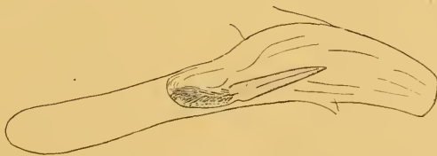
Abb. 3 Aedoeagus von Synaphe (?) schmidti (Hrtg.) Präparat Nr. M. 1003 (Spalato).

Die Genitalien eines von mir untersuchten Exemplares (Abb. 3) zeigen einen viel breiteren und kürzeren Cornutus als bei moldavica , dessen Längsstreifung kaum angedeutet ist. Seine Basalskulptur ist viel schwächer entwickelt als bei moldavica , reicht aber weit proximal. Ob es sich hier um eine individuelle Abnormität handelt oder ob dieser Bau für schmidti beständig ist, wäre durch weitere Untersuchungen nachzuprüfen.