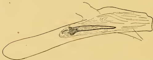
Abb. 6 Aedoeagus von Synaphe diffidalis (Gn.). Präparat Nr. M. 990 (Spanien).

Die Genitalmerkmale von diffidalis (Abb. 6) lassen keinen Zweifel an ihrer artlichen Selbständigkeit. Der Cornutus dieser