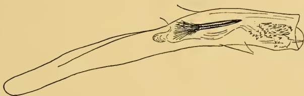
Abb. 8. Aedoeagus von Synaphe asiatica n. sp., Monotypus. Präparat Nr. M. 1006 (Kopek-dagh).

Der Aedoeagus (Abb. 8) sehr lang und schlank, mit starker