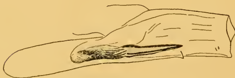
Abb. 5 Aedoeagus von Synaphe netricalis (Hb.), Präparat Nr. M. 993 (Palermo).

Die Genitalunterschiede zwischen netricalis und moldavica sind noch bedeutender (Abb. 5). Der Cornutus von netricalis ist