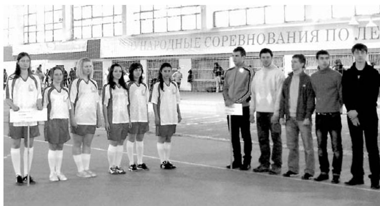
Открытие турнира «Мини-футбол – в вузы». Спорт №1 приобретает все большую популярность у представительниц прекрасного пола