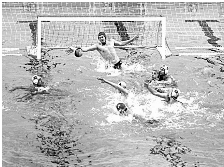
В атаке «Спартак-Волгоград» (игроки в темных шапочках)