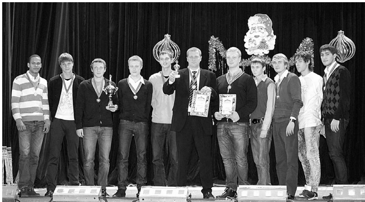
Команда Волгу – чемпион первого розыгрыша Студенческой лиги Волгоградской области

С приветственным словом к собравшимся на церемонии за-