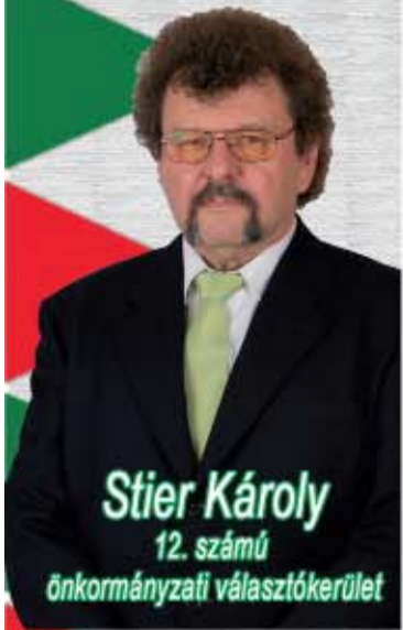
Stier Károly 12. számú önkormányzati választókerület