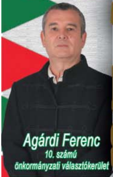
Agárdi Ferenc 10. számú önkormányzati választókerület