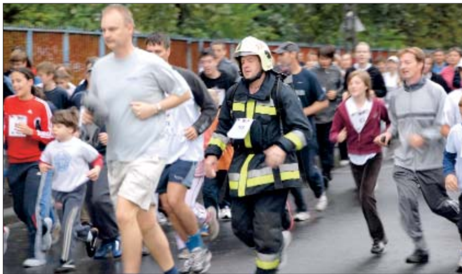
Volt, aki tűzoltó-felszerelésben futott

Harmincegyedik alkalommal rendezték meg idén a Csepel Futást, melyre több mint ezren vettek részt szeptember tizenegyedikén, reggel kilenc órától.