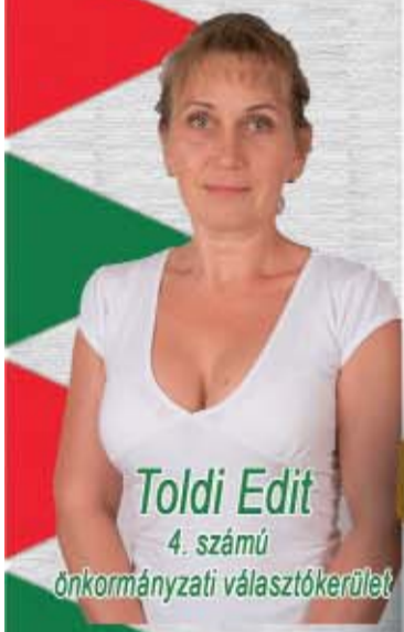
Toldi Edit 4. számú önkormányzati választókerület