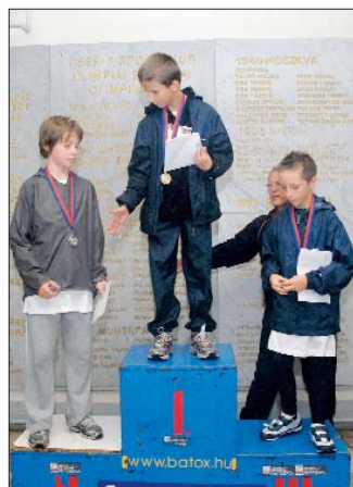
Az általános iskolai alsós fiú és lány győztesek