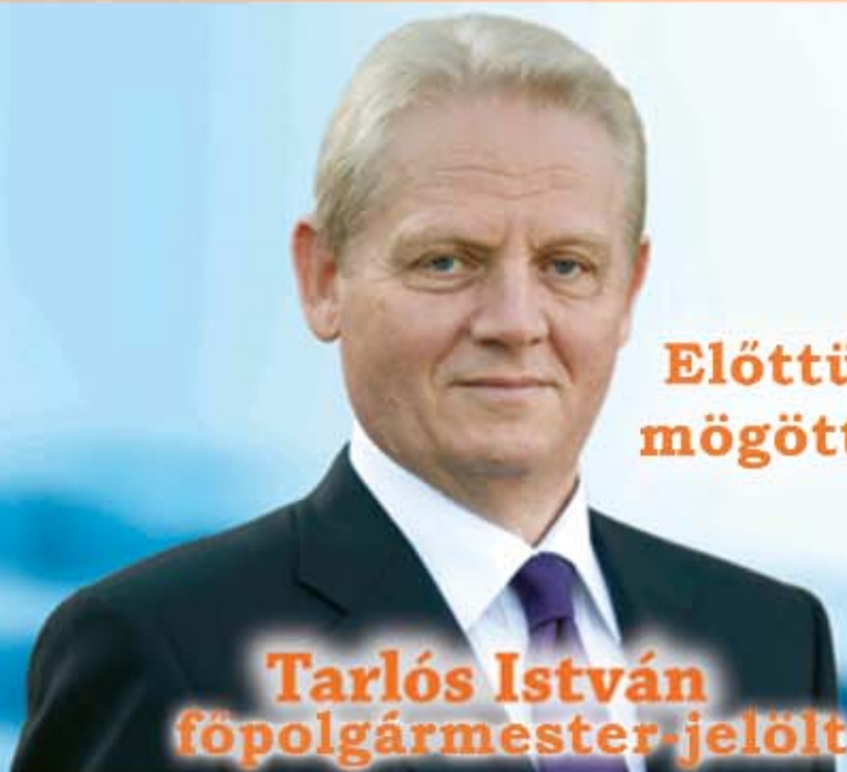
Tarlós István főpolgármester-jelölt