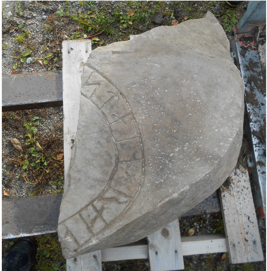
Det nyfunna fragmentet under flyttningen.

Det ligger nära till hands att tolka de bevarade runföljderna som orden 'sten' och 'resa', men ordningsföljden gör det troligare att 1–5 stain utgör slutet av ett namn, t.ex. Pōrstæinn eller Øystæinn .