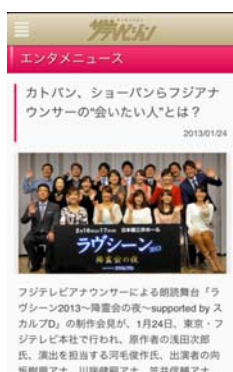
エンタメニュース