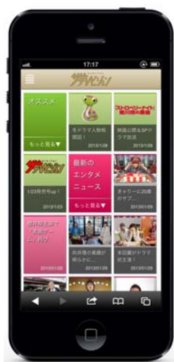
サイトトップイメージ