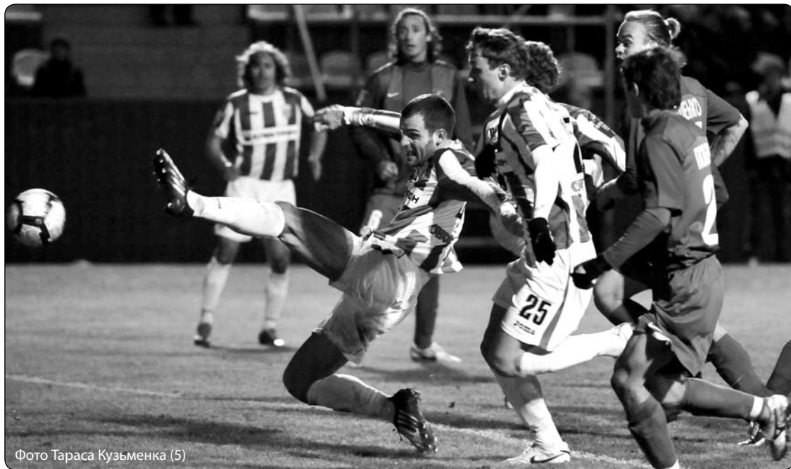
Фото Тараса Кузьменка (5)

тися ані на крок. Тож у нічийному результаті для нас немає жодного негативу, а позитив, хоча й не багато, є.