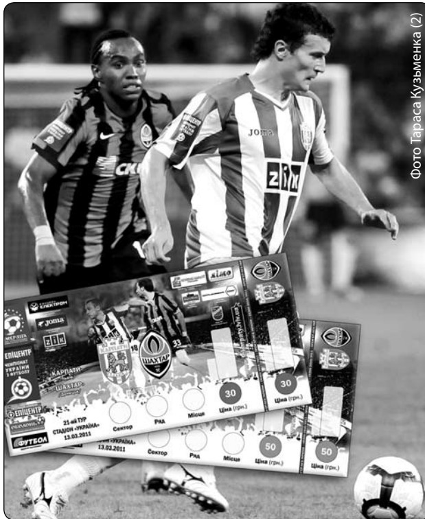
Фото Тараса Кузьменка (2)

Сьогоднішні «Карпати» здатні це зробити: лідери залишилися, новачки втираються в колектив, робота кипить. Незмінним фактором загального успіху залишилося лише одне – підтримка фанатів. Далекоглядні уболівальники вже потурбувалися про абонементи. Тим же, хто з різних причин не купуватиме сезонну перепустку, варто подбати про квитки. Їх можна купити в обох магазинах «Фанат» (вул. І. Франка, 32 та вул. Липова Аляя, 5), які працюють за звичними графіками. Тож у неділю, 13-го березня, 16:00, стадіон «Україна» і 28 тисяч тих, хто буде щиро вірити у перемогу «Карпат».