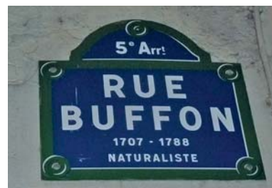
Die Rue Buffon (Links: © OpenStreetMap contributors; Foto rechts: Ehrhard Behrends)

Il y a donc une certaine largeur de la planche qui rendroit le pari ou le jeu égal.