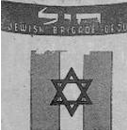
על שרולם נשאו החיילים תג ועליו סמל החי"ל - מגן-דוד צהוב על רקע צבע הדגל העברי.

ביום 20 בספטמבר 1944 נתפרסמה הודעה רשמית של משרד המלחמה הבריטי, שבה צוין, כי "ממשלת הוד מלכותו החליטה להיענות לדרישת הסוכנות היהודית לארץ-ישראל ולהקים בריגדה מוגברת יהודית (Jewish Brigade Group), אשר תשתתף בפעולות מלחמה. הבריגדה של חיל-הרגלים תהיה מבוססת על גזודים יהודים של הרג'מנט הארץ-ישראלי ועתה - - - מכינים יחידות סיוע ועזרה להשלמת הבריגדה המוגברת המבוססות על היחידות הארץ-ישראליות הקיימות". בהודעה שמסר צ'רצ'יל בבית-הנבחרים על הקמת הבריגדה ציין, כי אף על פי ש"מספר גדול של יהודים משרת בצבאותינו ובצבאות אמריקה בכל המחנות, נראה לי כיאות בהחלט, כי יחידה מיוחדת מאותו גזע שסבל סבל שאין לתארו מצד הנאצים תיוצג בפורמציה מובהקת בין החילות שנאספו להנחיל להם את תבוסתם הסופית".