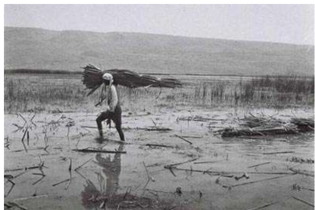
פלאח ערבי, אגם החולה