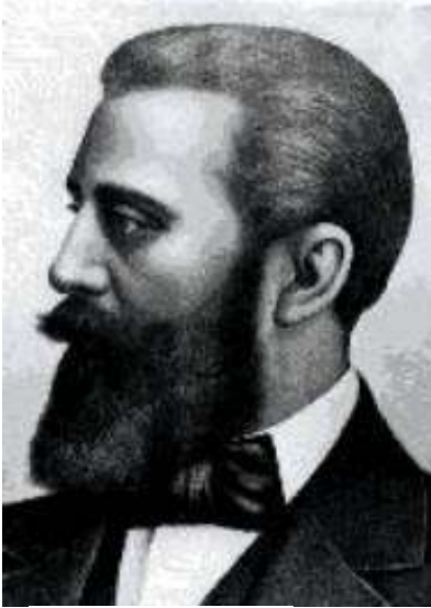
בנימין זאב הרצל