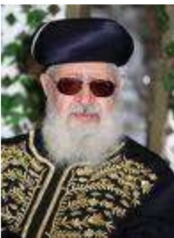
הרב עובדיה יוסף