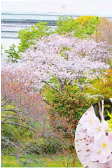
四季折々の花が見る人の目を楽しませる都立台場公園

記録的大雪だった冬も終わり、もうすぐ新学期、新年度ですね。今回は、お花見しながら歴史を感じられるスポット、都立台場公園をご紹介します。