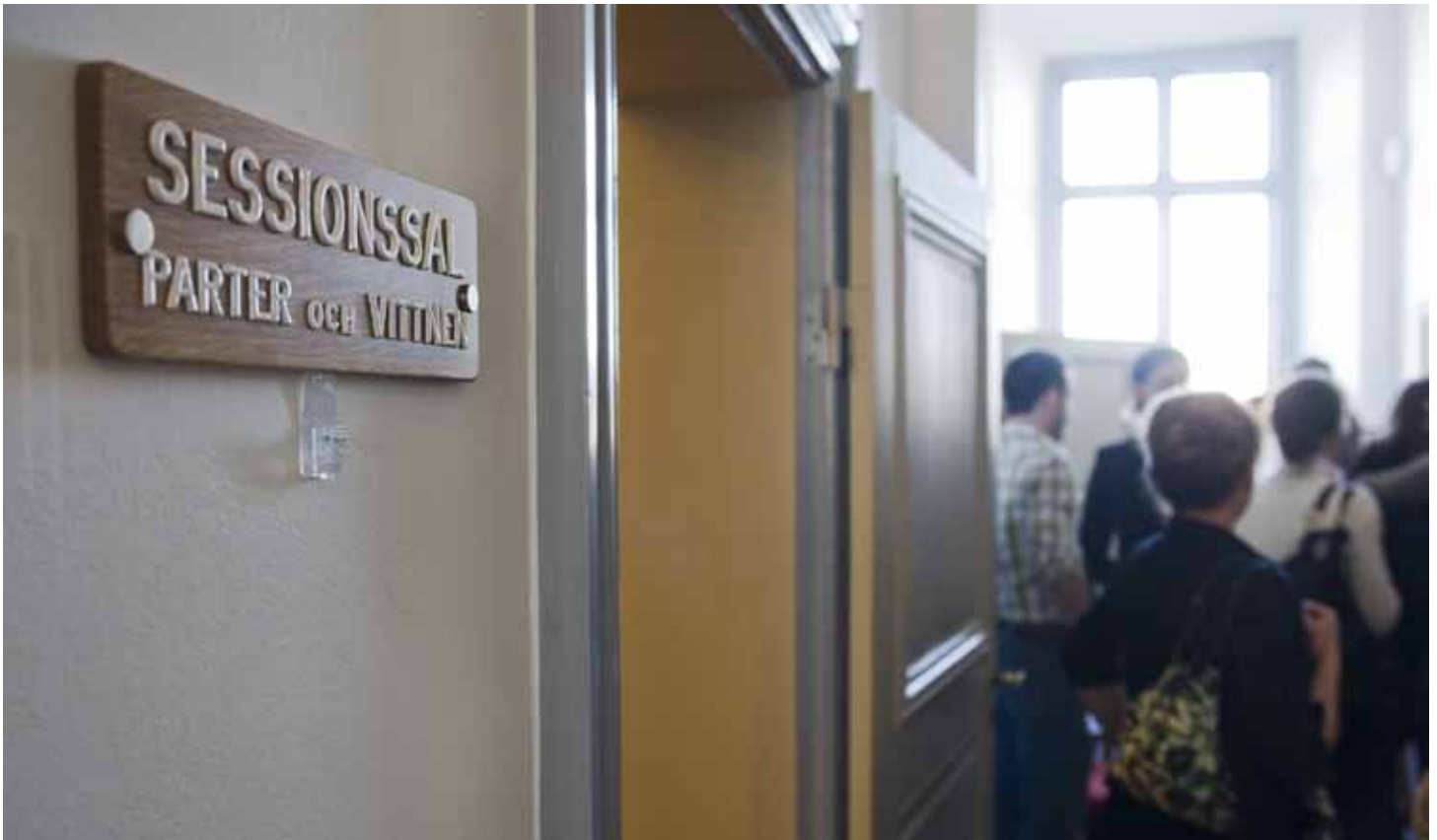
Med nya rättegångsbalken 1948 infördes regler om muntliga rättegångar även i Högsta domstolen.

andra frågor först. Får vi sedan ett besked från en hovrätt att ”den här frågan vill vi absolut ha prejudikat på” och man får ett överklagande som rymmer en del nackdelar, då kanske man släpper upp det ändå. Det blir en sammanvägning, och då kan det vara enormt viktigt att veta vad man ute på ”marknaden” bedömer som viktigt.