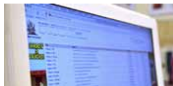
Det ska bli lättare att utreda sexualbrott på internet.

Regeringen presenterade den 11 november en första lagrådsremiss om hur EU:s datalagringsdirektiv ska införas i Sverige. Där skriver regeringen att den avser att lägga fram ytterligare