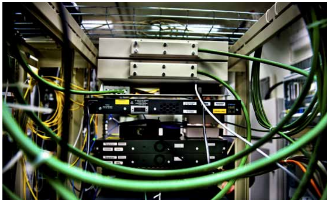
Regeringen föreslår att trafikuppgifterna bara ska få lämnas ut i brottsbekämpande syfte.

De har studerat varför vissa kriminellt aktiva väljer att avstå från brott – och har kommit fram till att olika vändpunkter i livet har stor betydelse. Sådana vändpunkter kan till exempel vara en kärleksrelation, en religiös upplevelse eller arbete. Pristagarna delar på priset om minst en miljon kronor. Priset delas ut vid konferensen Stockholm Criminology Symposium i Stockholm i juni 2011.