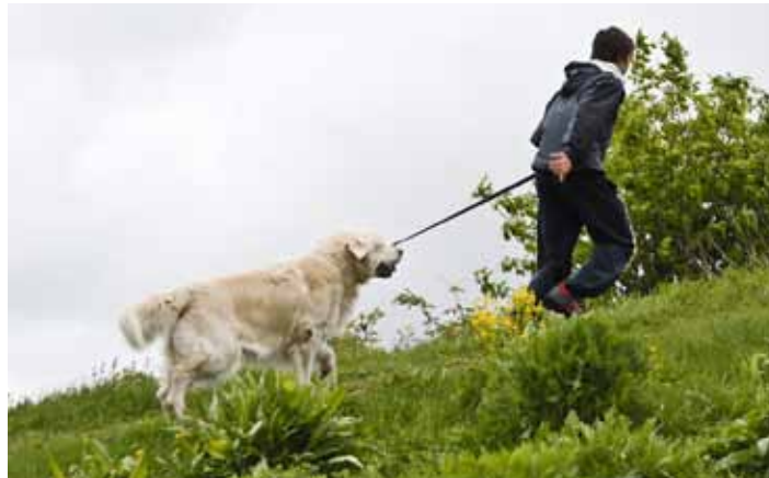
Utsatta djur ska få bättre villkor.

Gunilla Jarlbro, Vad jurister behöver veta om medier, Studentlitteratur, 2010.