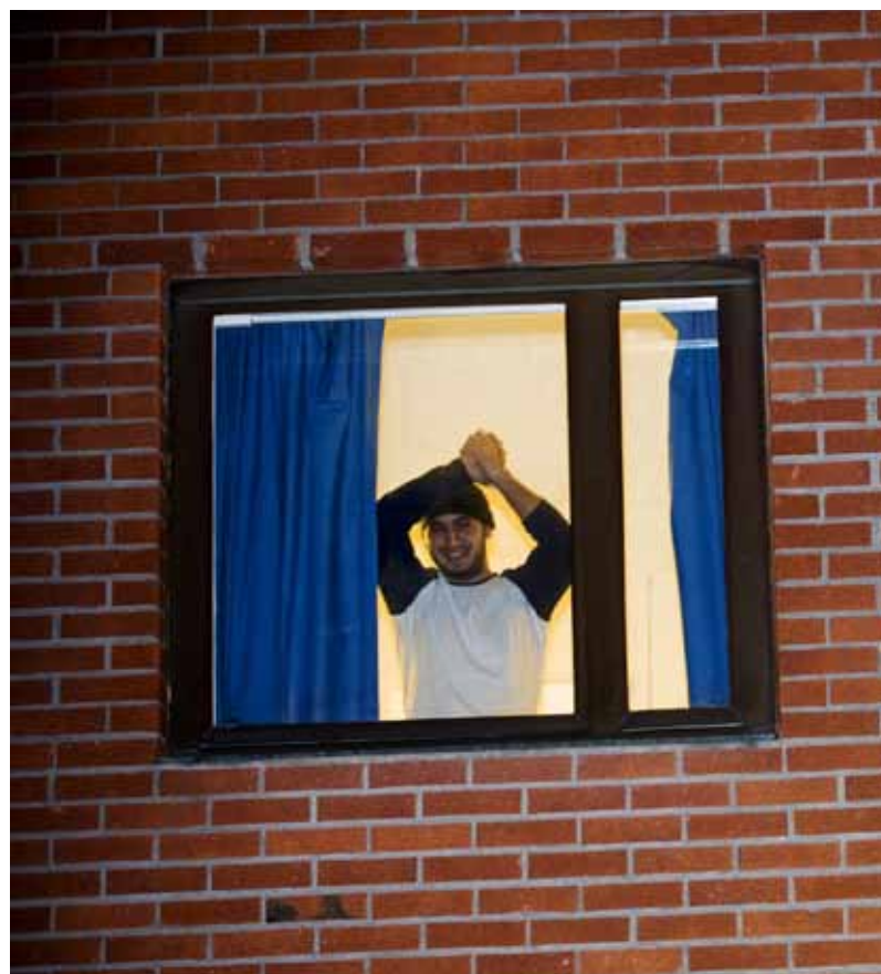
Irakiska flyktingar och demonstranter vid Migrationsverkets lokaler i Märsta utanför

Ryktet om Europadomstolens policy har spridits bland irakier i Sverige, och ansökningarna om inhibition har under de senaste veckorna mångdubblats. Bara under några få dagar i november fick domstolen ta emot runt 400 ansökningar om inhibition