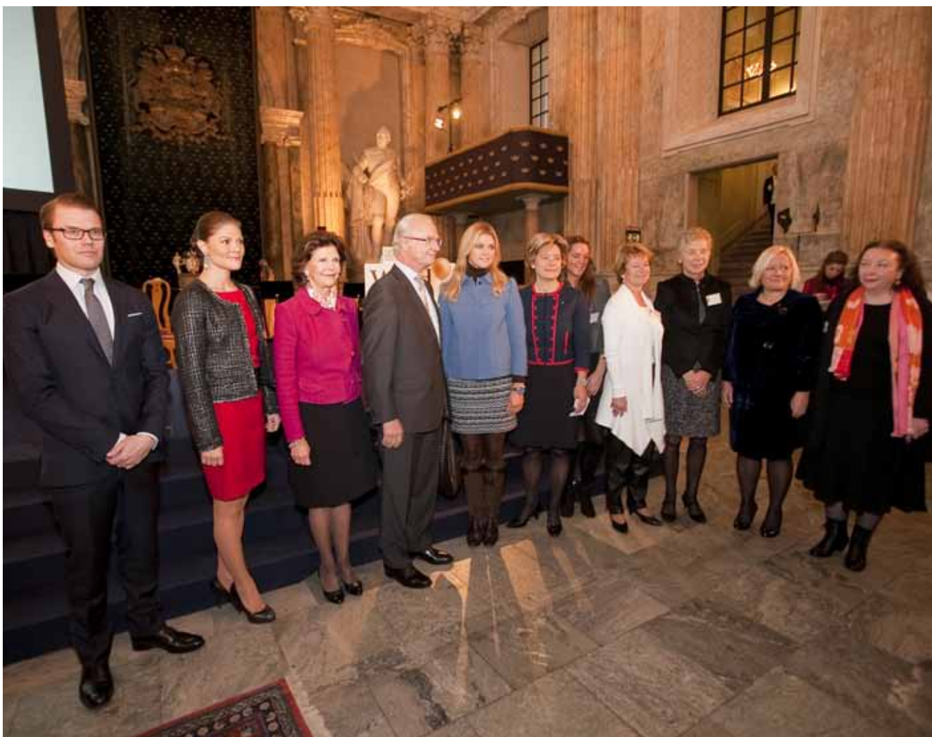
World Child & Youth Forum genomfördes för första gången den 19 november i Stockholm.