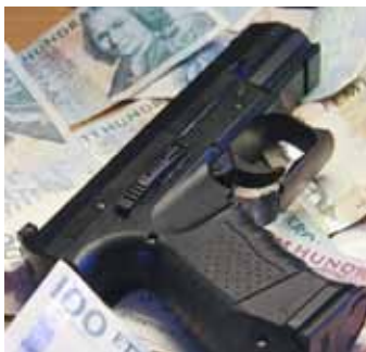
Religiösa upplevelser kan få kriminella att avstå brott.

Advokatsamfundet har uttryckt kritik mot tredjemansrevisionerna.