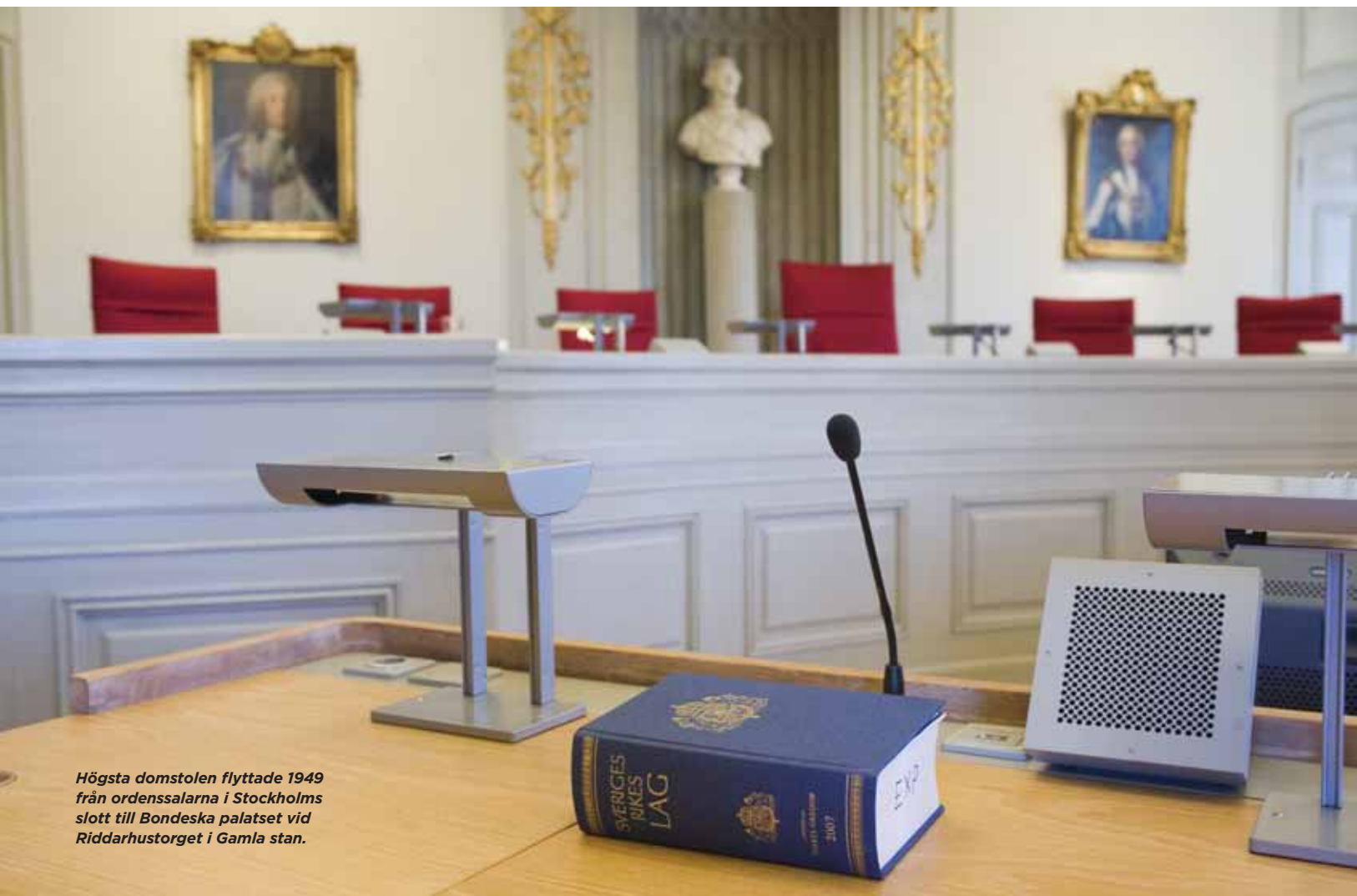
Högsta domstolen flyttade 1949 från ordenssalarna i Stockholms slott till Bondeska palatset vid Riddarhustorget i Gamla stan.