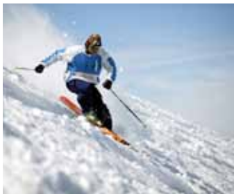
2009 stod Åre för arrangemanget.

Mer information finns på www.advokatsamfundet.se efter inloggning.