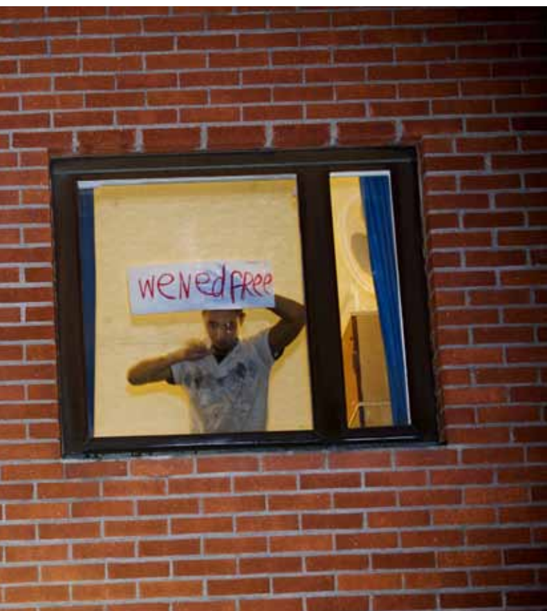
Stockholm den 16 november.

att regel 39 om inhibition generellt ska tillämpas på irakier som hotas av avvisning till de farliga områdena.