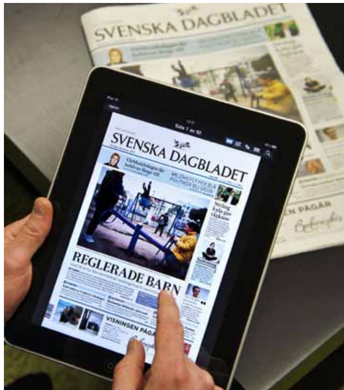
Arbetet med att ta fram en ny teknikneutral tryck- och yttrandefrihetsgrundlag väcker många frågor.