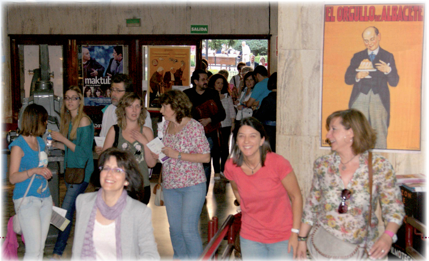
La iniciativa puesta en marcha por el COP-CLM se ha asentado en el tiempo