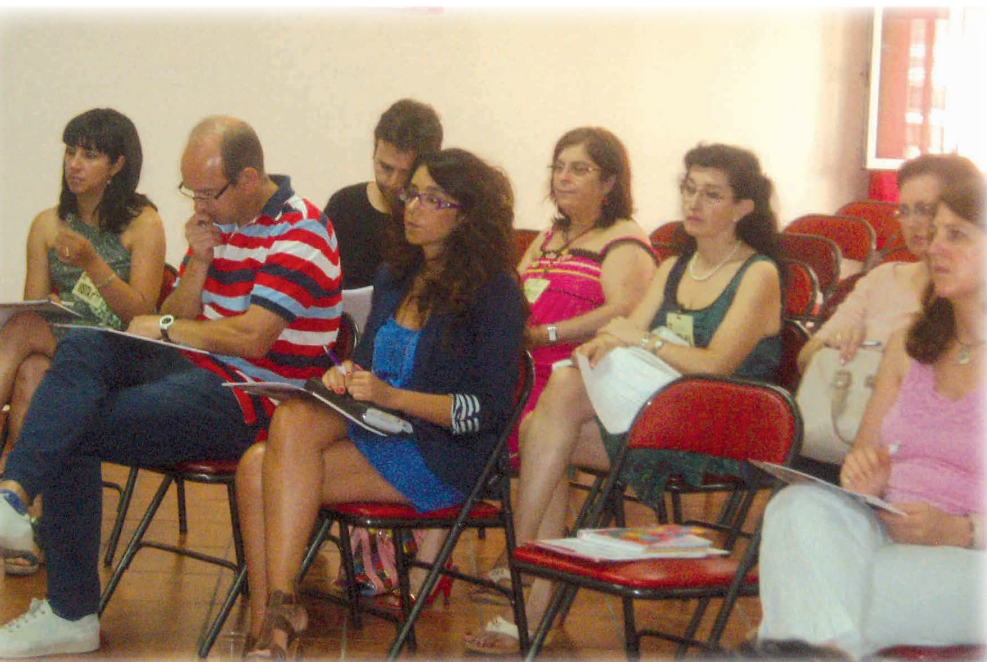
La institución colegial hizo balance de un año complicado