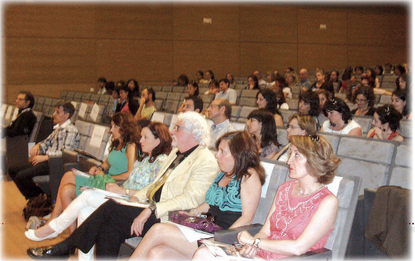
La quinta edición de la jornada suscitó un gran interés y congregó a un buen número de profesionales de la Psicología