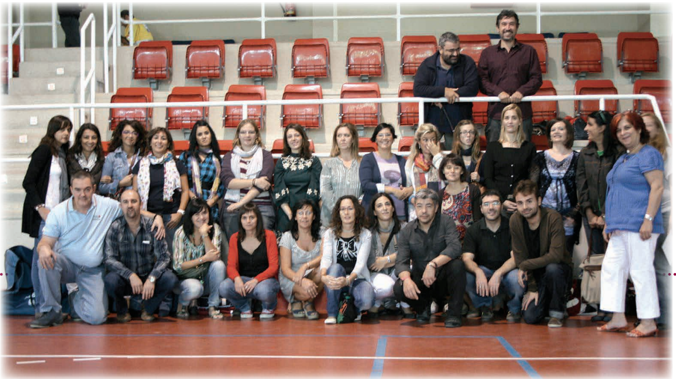
Los miembros del grupo tuvieron ocasión de compartir experiencias y conocimientos / COP-CLM