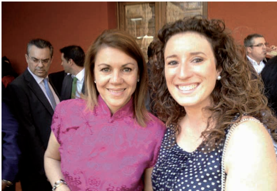
María Dolores Cospedal junto a Ana Pastor Barrón