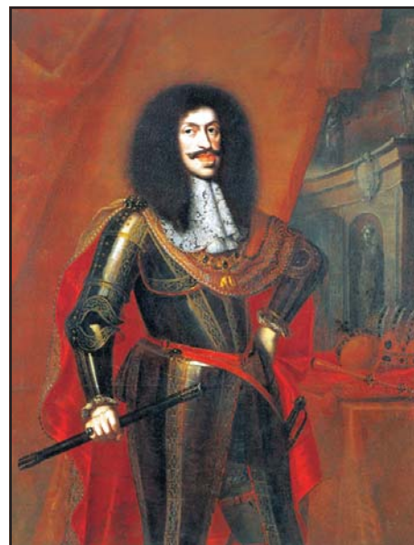
I. Lipót magyar király (1657–1705) és német-római császár (1658–1705). Benjamin Block festménye, 1672

A balkáni előrenyomulás rövid életűnek bizonyult. A Franciaország és a Német-római Birodalom között kirobbant pfalzi örökösödési háború (1688–1697) Lipót kétfrontos küzdelemre kényszerítette. Csakhamar csorbát szenvedtek a császári fegyverek nyugaton és keleten is. Nyugaton francia kézre került Philippsburg, Speyer és Worms a Rajna mentén (1688. szeptember – 1689 tavasza).