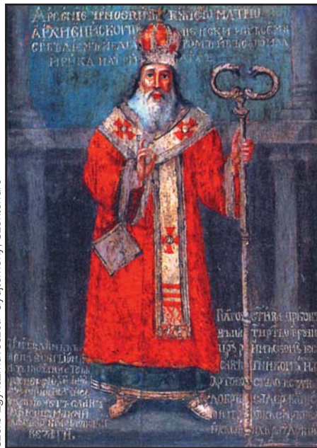
III. Arsenije Černojević szerb pátriárka főpapi ornátusban. Festett fa, 18. század vége

A második kiváltságlevél növelte az egyház világi hatalmát. Kimondta: az utód nélkül elhunyt pravoszláv hívők vagyona az egyházra száll, és felruházza a pátriárkát alacsony rangú szerb katonatisztek kinevezésének, egyes világi peres ügyek elrendezésének, valamint céhstatútumok (-szabályzatok)