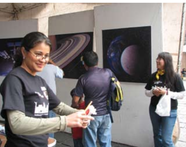
Exposiciones sobre astronomía y temas pueden ser apreciadas en las ferias.

De junio a noviembre, se realizaron 25 ferias a las que asistieron más de 40 mil personas