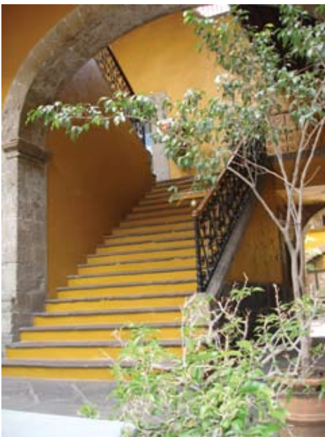
Escalera principal del edificio sede del ICyTDF.

Una de las principales misiones del Instituto de Ciencia y Tecnología del Distrito Federal (ICyTDF) es resolver los problemas de la Ciudad de México, por medio de la implementación de los adelantos científicos y tecnológicos que llevan a cabo las diferentes instituciones que radican en ella.