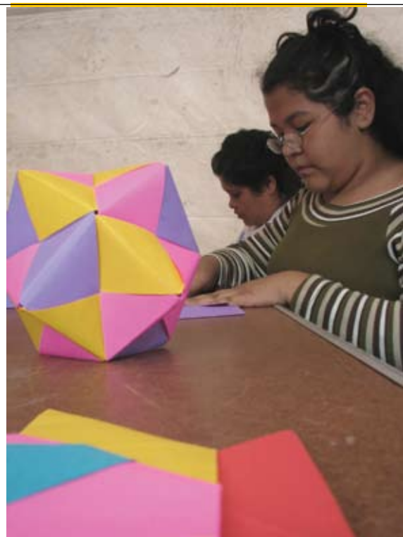
Las actividades incluyen el taller de origami.

Hasta noviembre de 2007, se realizaron 25 eventos en los que participaron más de 40 mil personas de todas las edades.