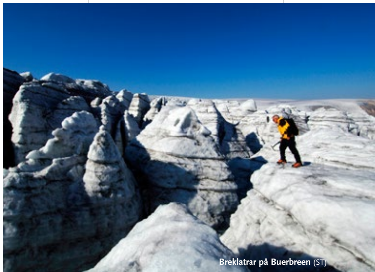
Breklatrar på Buerbreen (ST)