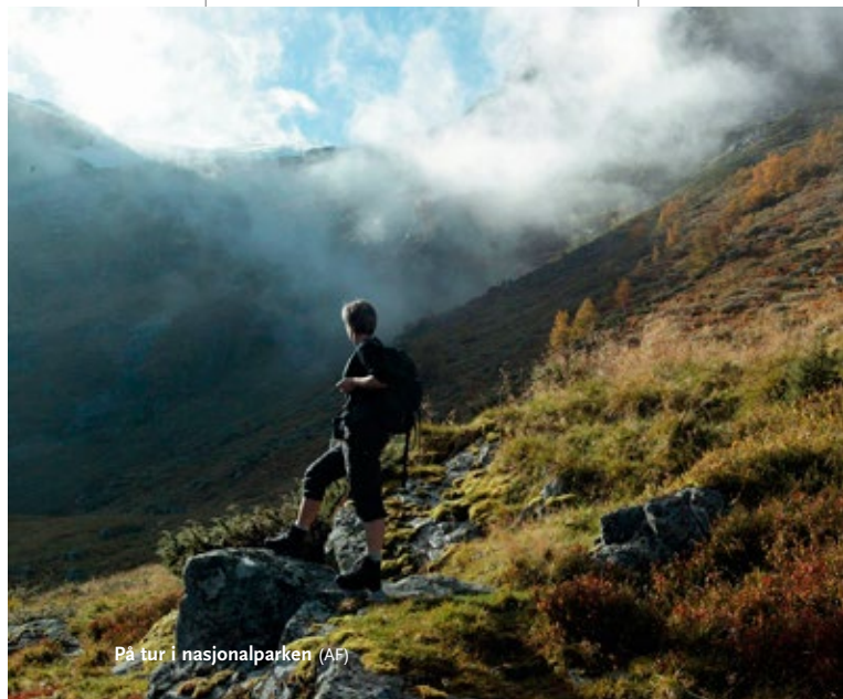
På tur i nasjonalparken (AF)

På vestsida av Folgefonna og nedover i dalføra er nedbøren høg, og det gjør at du finn mange planter som trives best i fuktig klima. Sjølv den ekstremt vestlege hinnebregna veks så langt aust som til Furebergfossen på grunn av det konstant våte lokalklimaet i drevet frå fossen. Kystplanter som revebjelle, rome, klokkeling, bjønnekam, smørtelg og storfrytle set eit preg på vegetasjonen frå fjorden og opp mot skoggrensa.