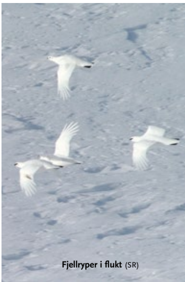
Fjellryper i flukt (SR)