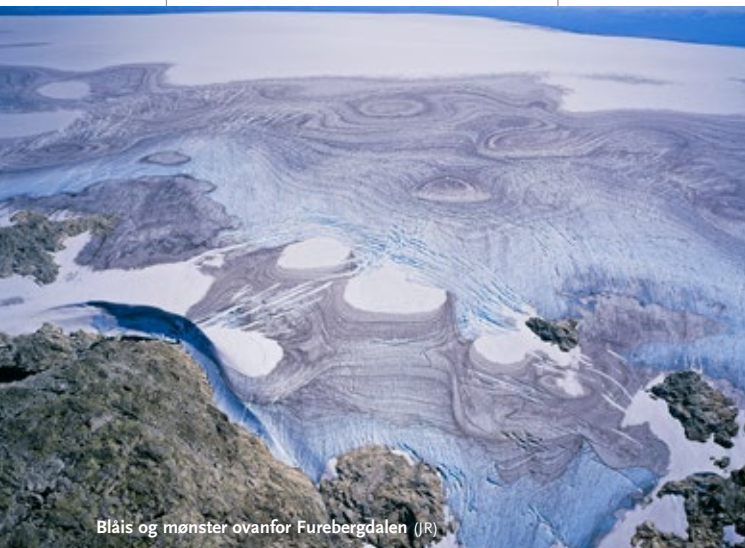
Blåis og mønster overfor Furebergdalen (JR)