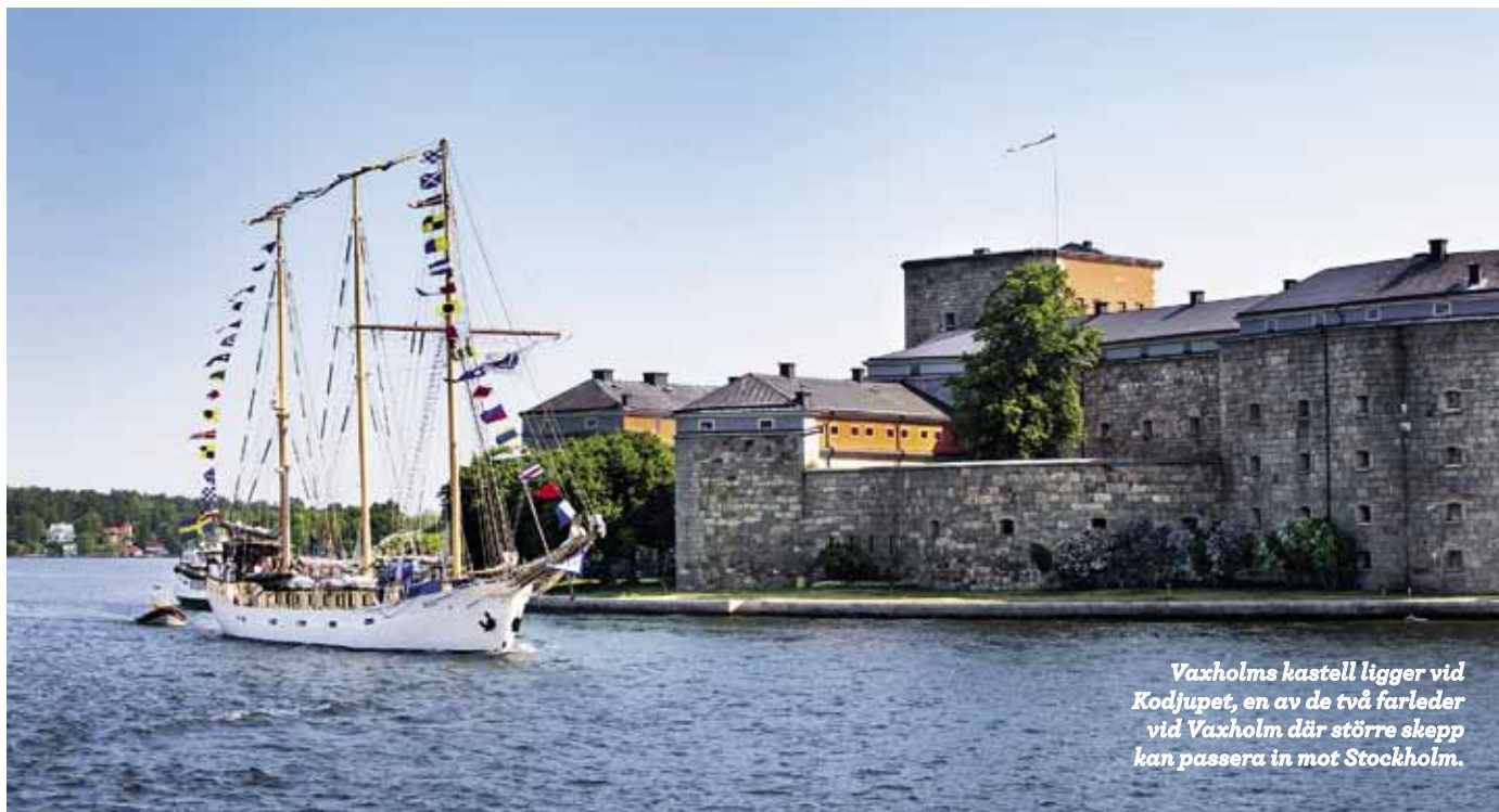
Vaxholms kastell ligger vid Kodjupet, en av de två farleder vid Vaxholm där större skepp kan passera in mot Stockholm.