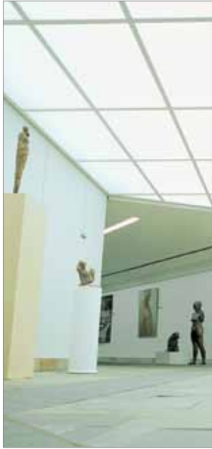
Galerie d'Art Contemporain