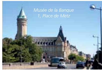
Musée de la Banque 1, Place de Metz