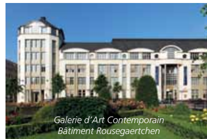
Galerie d'Art Contemporain Bâtiment Rousegaertchen