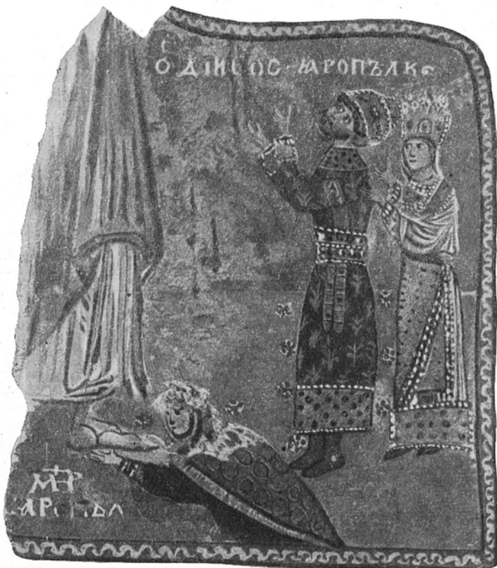
Рис. 3. Выходная миниатюра «Кодекса Гертруды» (деталь)

В самом несовпадении имен Гертруды и Олисавы, принадлежащих, таким образом, одной и той же княгине, еще нет никакого противоречия. Гертрудой жена Изяслава Ярославича могла, например, называться в девичестве, а затем постоянно пользоваться этим именем в быту. Олисавой, т. е. в канонической форме Елисаветой или Елисаветой, она стала, выйдя замуж и приняв православие, однако это имя как крестильное употреблялось только в определенных случаях, подобно крестильным именам князей. Последние постоянно именовались Изяславами, Святополками, Владимирами, Мстиславами, хотя и бывали крещены с именами Димитрий, Михаил, Василий и т. п. О живучести иноземных имен русских княгинь говорит обычай давать иногда тройные имена детям, родившимся от браков русских князей с иноземными принцессами. Так, Мстислав, сын Владимира Мономаха и Гиты Гаральдовны, назывался кроме того Феодором и Гаральдом 19 .