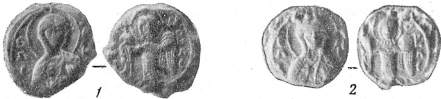
Рис. 4. Печати с изображением святых Елизаветы и Гавриила

1 — Эрмитажный экземпляр; 2 — Львовский экземпляр