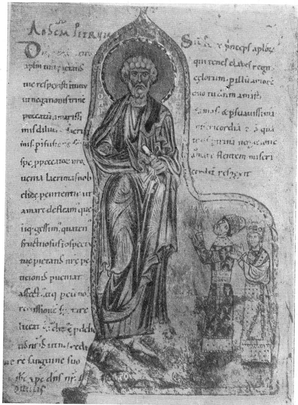
Рис. 1. Выходная миниатюра «Кодекса Гертруды»