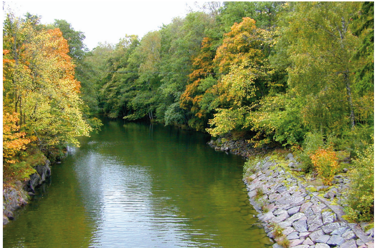
Längs Karls Gravs stenskodda sidor finns värdefulla lövskogsmiljöer. Nedan.