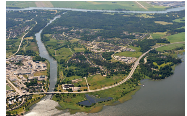
De gamla pollarna längs kanalen är historiska spår. Viss skötsel behövs för att motverka att pollarna skymms av igenväxning utmed kanalens sidor. Till höger.

Förr översvämmades de låglänta markerna vid