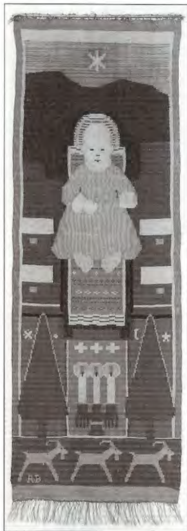
"Julbonad med Lars" vävd i baute-lisse-vävstol av Handarbetets vänner 1906.

landskapsdelens. Hon gör därvid jämförelser mellan Dalarnas textilier. I likhet med Lilli Zickerman lägger hon speciellt märke till de olika färgskalor som fanns i skilda bygder och som hon ansåg bero på människornas färgval, men även på de varierande växtfärger som naturen erbjuder. I de kargare och mera traditions-