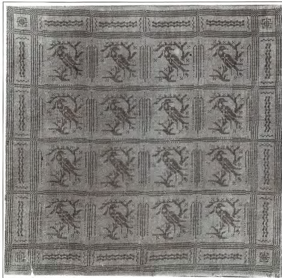
"Fågel på kvist", damastduk, vars mönster är komponerat efter en gammal förebild. Vävd i vävateljén i Lilla Växnäs herrgård.

Dessa unga krafter bör vara kunniga både estetiskt och tekniskt,