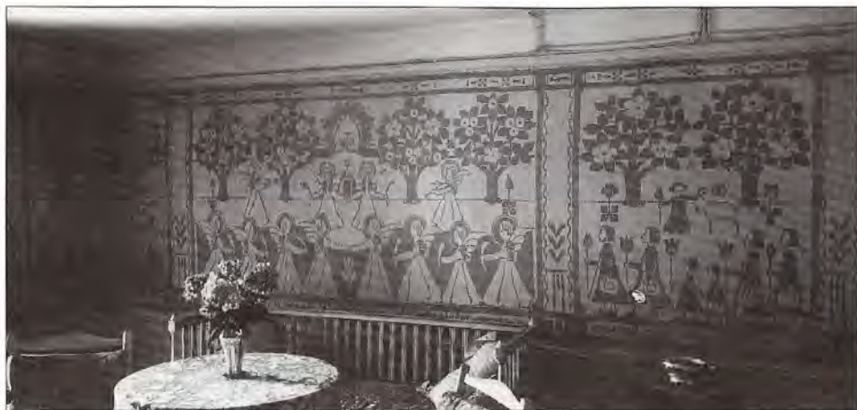
"Jerusalem", vävnad i dukagångsteknik uppsatt i Selma Lagerlöfs hem i Falun. Komponerad liksom följande kompositioner i bild av Anna Wettergren.