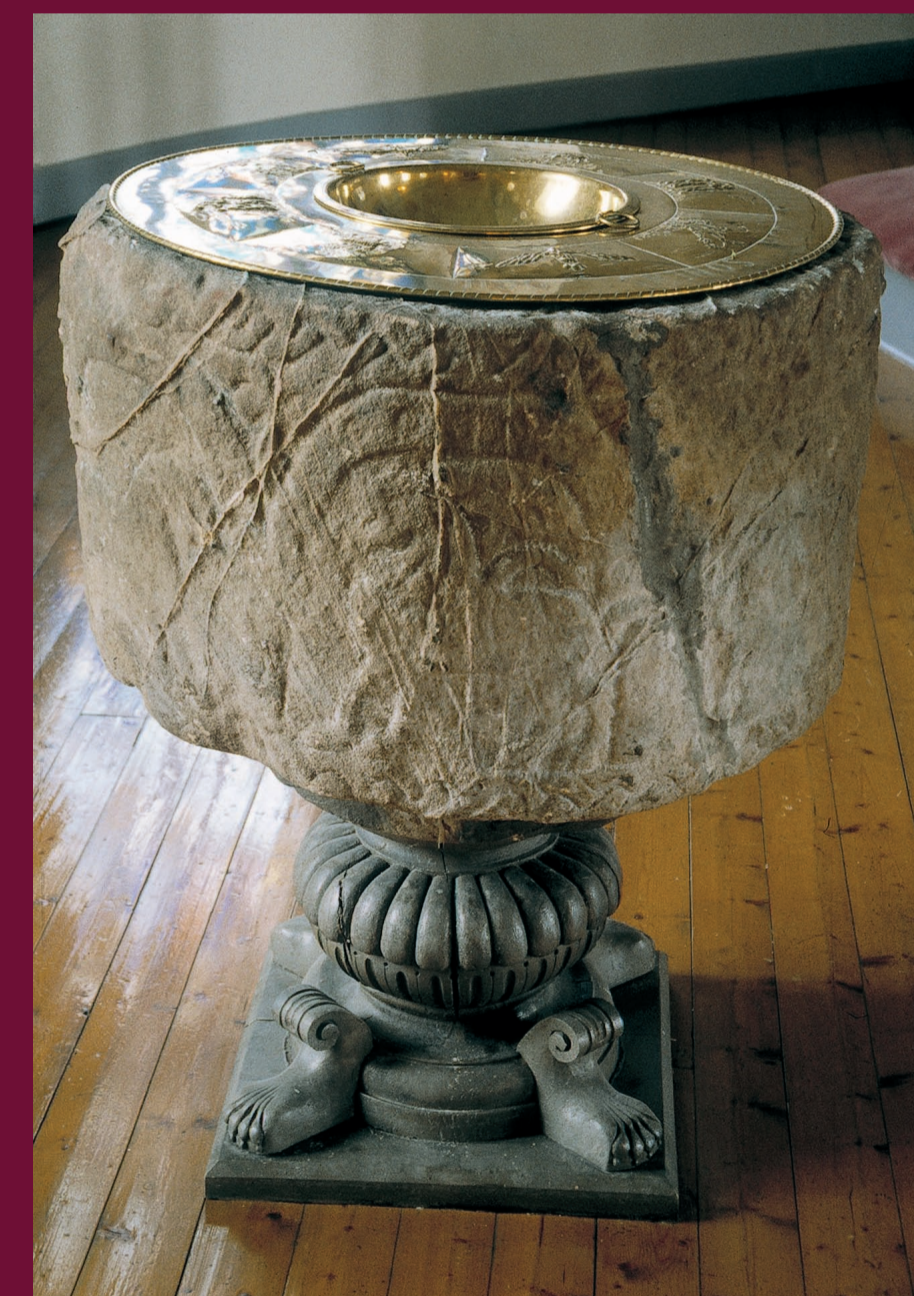
Bevarad medeltida fabeldjursfunt, idag placerad i nya kyrkan.

Hier lag bis 1855 die mittelalterliche Kirche von Kalvsvik. Es handelte sich hierbei um eine Saalkirche mit gerade geschlossenem Chor. Die Wände bestanden aus liegenden, behauenen Fichtenhölzern mit Eichenschwellen. Der ursprüngliche Eingang der Kirche lag auf der südlichen Seite des Langhauses, es soll aber auch einen Eingang am Chor gegeben haben. Die ursprünglichen Fensteröffnungen entsprachen sowohl hinsichtlich der Größe als auch ihrer Platzierung den kleinen, hoch angebrachten Fensterschlitz in Granhult. Diese Kirche wurde durch dendrologische Analyse, d. h. durch Bestimmung des Holzalters und der Jahresringe, auf die Zeit um 1220 datiert. Dasselbe dürfte für die alte Kirche von Kalvsvik gelten. Bei einer Kircheninventur im Jahre 1826 wurde vermerkt, dass die Kirche allzu klein für die wachsende Gemeinde wurde. Zwei Jahre nach Fertigstellung der neuen Steinkirche im Jahr 1853 wurde die Mittelalterkirche abgerissen.