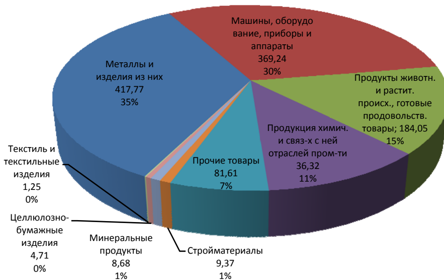
Рисунок 2. Структура потенциального экспорта Казахстана в Туркменистан в разрезе товарных групп, млн. долларов США