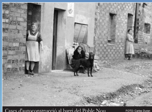
Cases d'autoconstrucció al barri del Poble Nou