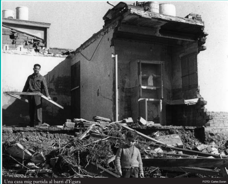
Una casa mig partida al barri d'Ègara

La riera de les Arenes va desviar el seu curs en els blocs dels grups de Sant Llorenç i va discórrer per una antiga llera, assolant pel marge dret l'actual barri d'Ègara, "el triangle de la mort", on provocà més d'un centenar de víctimes i enderrocà moltes casetes.