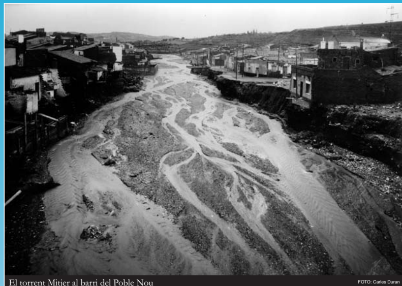
El torrent Mitjer al barri del Poble Nou

La riera del Palau, que neix al nord del terme, passava per la rambla d'Egara mitjançant un col·lector, i després s'unia a la riera de les Arenes. Aquesta riera travessava la ciutat sense canalitzar i formava, a les Fonts, la riera de Rubí.