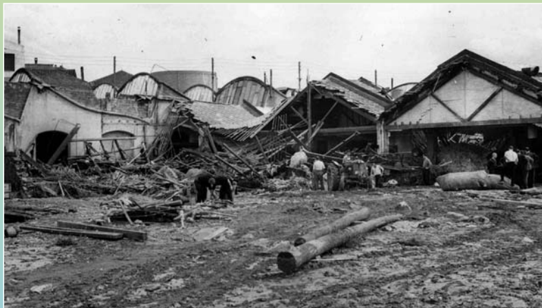
La riuada destruí les indústries del capdamunt de la Rambla d'Ègara