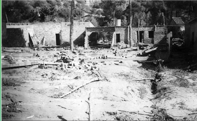
Aspecte del barrio nuevo de les Fonts

Al pla de les Fonts, on s'uneixen les rieres del Palau i de les Arenes, la riuada assolí prop de tres metres d'altura i s'emportà l'anomenat barrio nuevo , arrasant vuitanta cases i produint un centenar de víctimes. També s'endugué dos ponts.