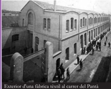
Exterior d'una fàbrica tèxtil al carrer del Pantà

.En plena dictadura franquista, privada de les llibertats fonamentals, amb les autoritats designades a dit i els ciutadans considerats com a súbdits, Terrassa creixia de forma desordenada i desigual sota l'impuls de la indústria tèxtil.