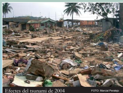
Efectes del tsunami de 2004