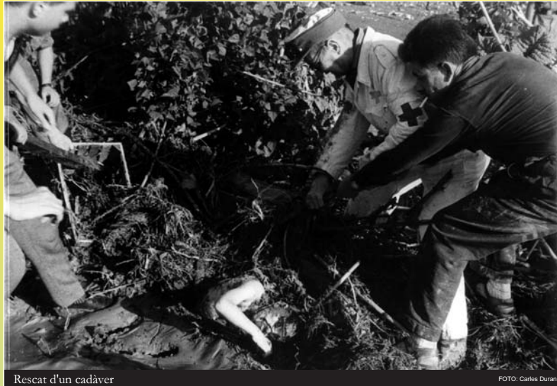
Rescat d'un cadàver