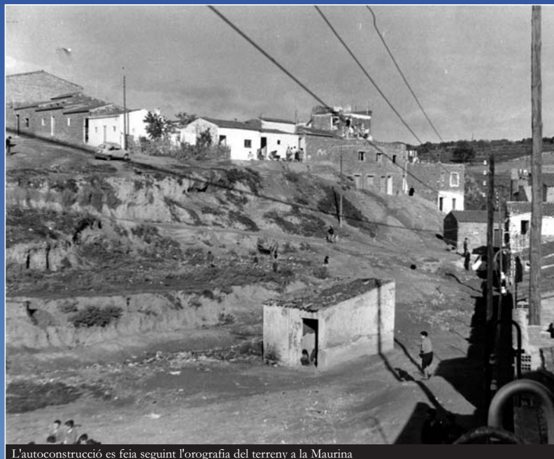
L'autoconstrucció es feia seguint l'orografia del terreny a la Maurina

La falta d'habitatges assequibles per als nouvinguts va portar-los a viure rellogats, en estades, o bé a construir-se les seves pròpies casetes en terrenys barats dels rodals, mal comunicats amb el nucli de la ciutat i sense cap servei bàsic.