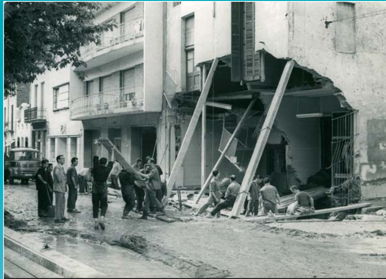
Façana enderrocada la rambla d'Ègara