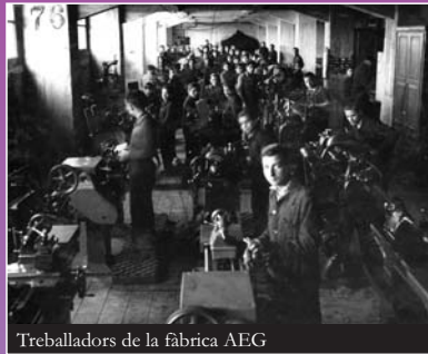
Treballadors de la fàbrica AEG

L'art tèxtil hegemònic a la ciutat progressava per l'ocupació de molta mà d'obra barata, explotada per mitjà de llargues jornades de treball i hores extres, amb salaris minsos, i per la pluriocupació, sense una tecnologia homologable a Europa.