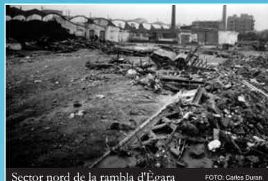
Sector nord de la rambla d'Ègara

Sense llum, només amb la claror dels llamps, els veïns pujaren a les terrasses i teulades fugint de la inundació de les plantes baixes, escoltant els crits d'auxili de persones desesperades que s'havien enfilat als arbres o que la riuada s'enduïa.