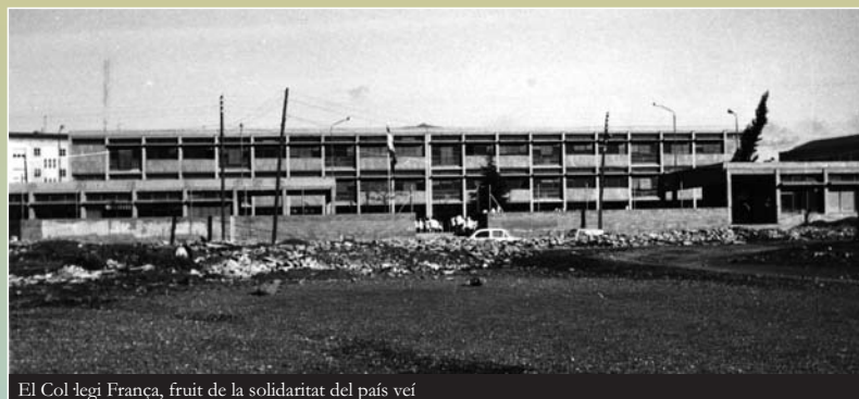
El Col·legi França, fruit de la solidaritat del país veí

La nostra ciutat va rebre el caliu solidari de Catalunya, d'Espanya i d'arreu del món, en forma tant de tones de materials (roba i aliments), com d'aportacions econòmiques que superaren els dos-cents milions de pessetes, malgrat que aquestes ajudes es distribuïssin malament i sense la participació dels afectats.