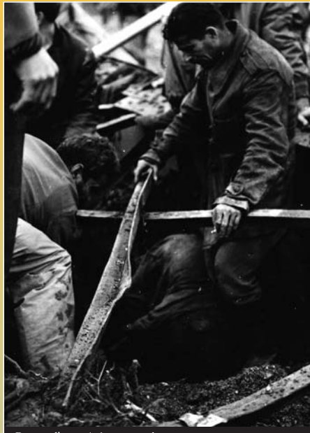
Rescat d'una víctima mortal

Malgrat la falta de coordinació oficial en l'emergència, la ciutadania terrassenca va respondre amb coratge i abnegació per rescatar i auxiliar les víctimes. De la riuada, en naixeria solidaritat i associació, com la dels veïns del barri de les Arenes.