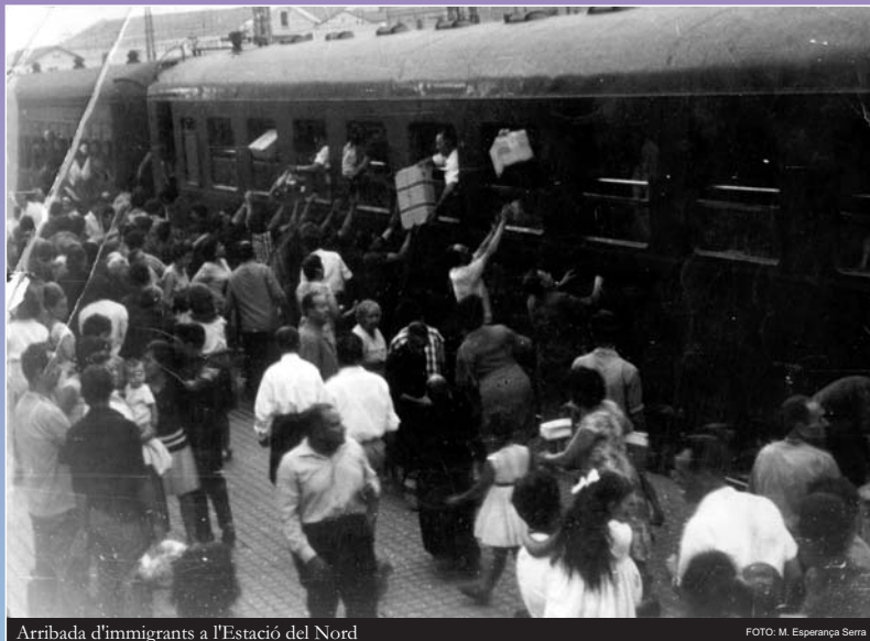
Arribada d'immigrants a l'Estació del Nord

L'art tèxtil hegemònic a la ciutat progressava per l'ocupació de molta mà d'obra barata, explotada per mitjà de llargues jornades de treball i hores extres, amb salaris minsos, i per la pluriocupació, sense una tecnologia homologable a Europa.