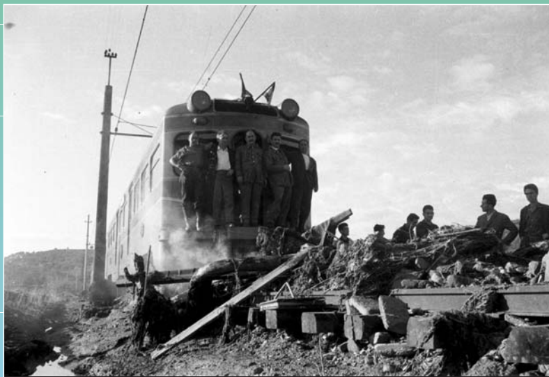
El tren es va aturar a Can Coret, a uns 500 metres de l'estació

El tren dels Ferrocarrils de Catalunya es va aturar a Can Coret i salvà així la vida de 105 passatgers. També el tren de la RENFE cap a Barcelona, amb 311 passatgers, va parar a Ca n'Anglada prop del pont que la riera s'endugué. Totes les carreteres van quedar tallades per col·lapse dels ponts o per la inundació.