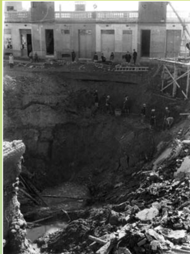
Esvoranc al carrer Ample