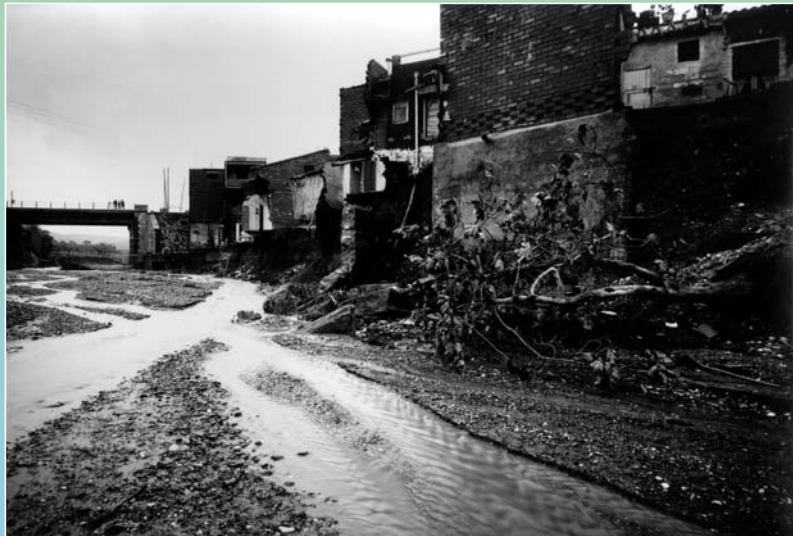
La riera del Palau a l'alçada del pont de la carretera de Rellinars

A Sant Pere Nord, s'ensorraren cases dels carrers del Consell de Cent i de Roca i Roca. Al Poble Nou, el torrent Mitger va endur-se diversos habitatges i també va haver-hi víctimes mortals a l'entorn del torrent de la Maurina.