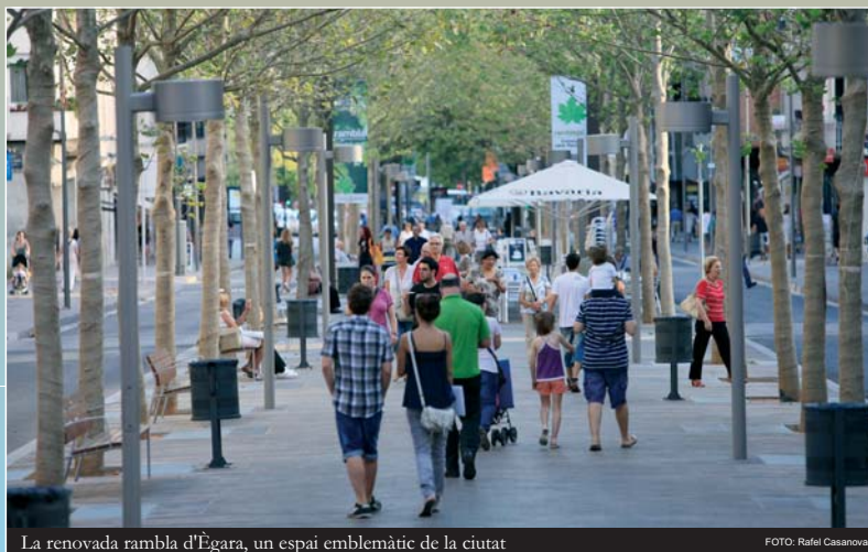
La renovada rambla d'Egara, un espai emblemàtic de la ciutat

Ara la ciutat es regeix pel Pla d'ordenació municipal de l'any 2003 i Terrassa, que ha doblat la població de 1962, és, malgrat la crisi econòmica general, una ciutat amb una bona qualitat de vida que disposa d'una notable xarxa de serveis públics per a tothom.