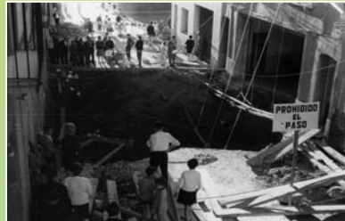
Reparació del forat al carrer de Cervantes

Els estralls de la riuada no es van limitar als de les rieres de les Arenes i del Palau. S'esfondraren els col·lectors dels actuals carrers de Cervantes, Ample i d'Emili Badiella, i com a conseqüència es produïren diverses víctimes mortals i l'esfondrament de cases.