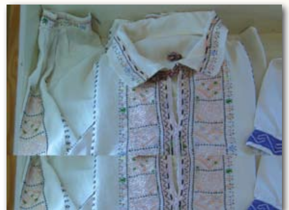
מוצגים ותמונות מהמוזיאון