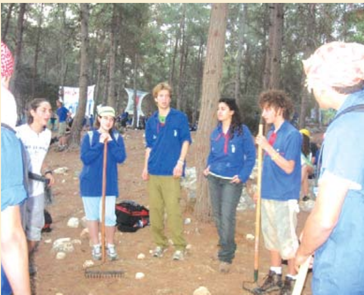
חניכי התנועה במהלך הפעילות

בסוכות יצאו חניכי תנועת הנוער לטיול המשולב בתרומה לסביבה ולאוהביה