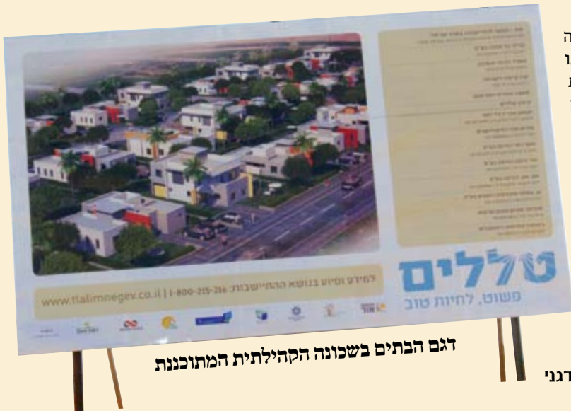
דגם הבתים בשכונה הקהילתית המתוכננת

קיבוץ טללים הקטן מתכנן לקלוט 90 משפחות. החודש התקיים בקיבוץ יום פתוח, וההתעניינות גדולה