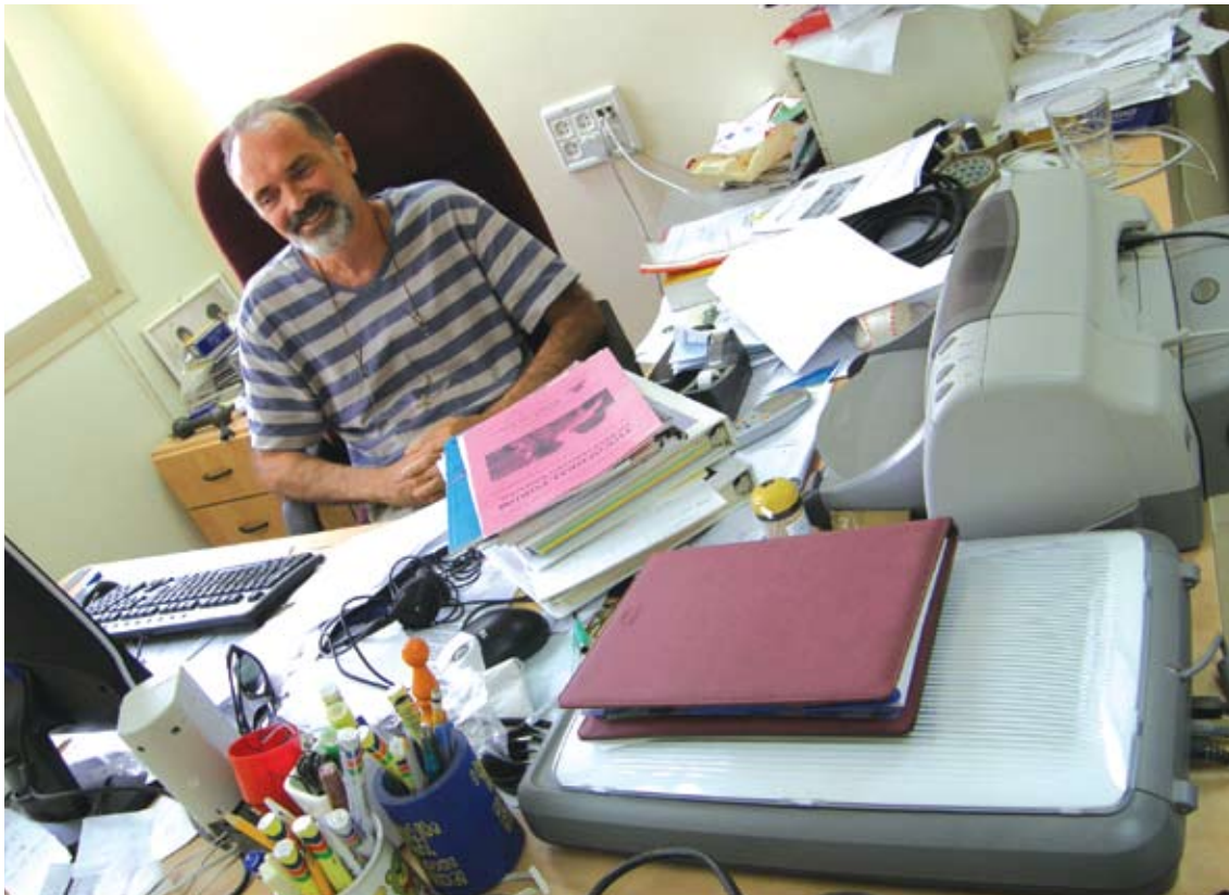
"החליטו בקיבוץ שהם רוצים להכניס מחשבים לבית הספר היסודי. לא היה לי שום ניסיון בנושא, אבל לקחו אותי כי אני היחיד שיכול לקרוא ספר הדרכה באנגלית"