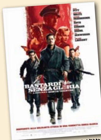
ממזרים חסרי כבוד

● הרטיטי אל לבי. הצגת מנויים מס' 2. 4.11.09, 21:00, אולם גולדה, רביבים.