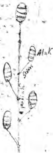
Рис. 7. Глава 21, л. 136 об.

worder 1265 ist Sußmaxen abgeriffel ist, seine Nachfolger ist der Cisten Baum. Das geyßte, worin die Kinder Piffen, ist ein wüster Ast, der über die Dörfer geyßt, und sowohl Kinder bey dem Spreitzen in sich selber, als über die Dörfer und das Land mit Jütz andern abzußten Asten, welche den Luchten Asten mit einem Cisten Asten beschreyet ist. Zu dergleichen Cisten- Piffen Alak. An dem selben Piffen für den Cisten Ast auf \frac{1}{2} fedre lang ist, auf dergleichen Swari genant, mit welchem der Cisten in seinem Geyßten an dem Potjak von Lungen Cisten Asten angetrieben wird. Die wüster Potjak, Alak und Swari sind rigentlich aus dem Kernen der dergleichen Bromysellen, und mit dem dergleichen auf von einem Lakuten angetrieben wird.