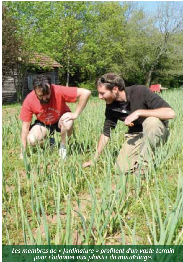
Les membres de « Jardiculture » profitent d'un vaste terrain pour s'adonner aux plaisirs du maraîchage.

Tout au long de l'année, de nombreux maraîchers se retrouvent Chemin du Sémaphore pour jardiner ensemble. Rencontre avec les adhérents de « Jardiculture ».