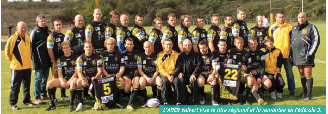
L'ARCB Valvert vise le titre régional et la remontée en Fédérale 3.

Deuxième de son championnat, l'ARCB Valvert affrontera dimanche Aytré pour la troisième fois en quinze jours. Avec pour horizon la finale régionale à Rebeilleau, préambule à une entrée en phases finales nationales.