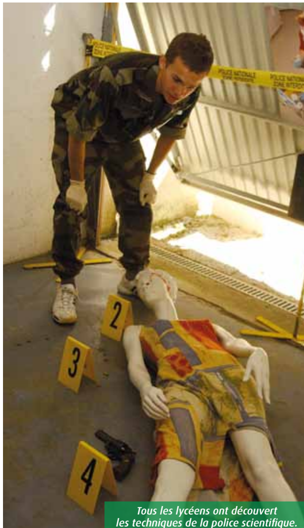
Tous les lycéens ont découvert les techniques de la police scientifique.

C'est dans ce contexte que s'est déroulé, mercredi dernier à Poitiers, un rallye citoyen. Une centaine de lycéens, habillés en tenues kaki par l'armée, sont allés à la rencontre de policiers, pompiers, militaires