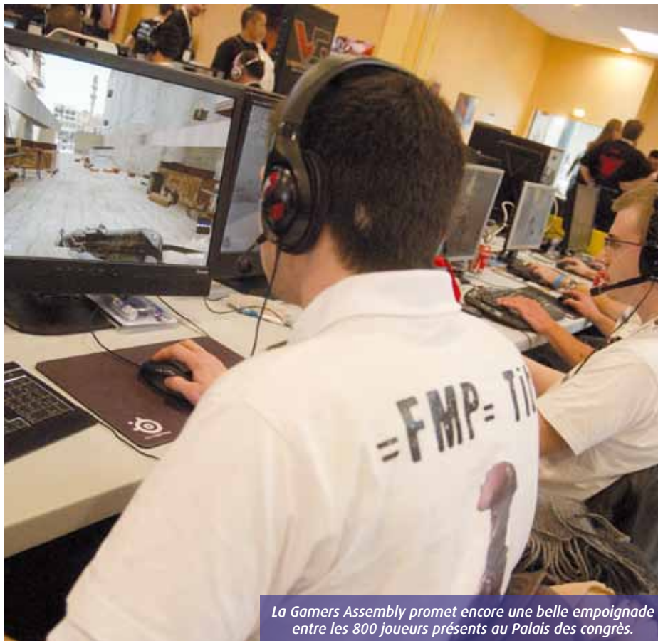
La Gamers Assembly promet encore une belle empoignade entre les 800 joueurs présents au Palais des congrès.

Le week-end de Pâques (23-25 avril) s'annonce très ludique, en tout cas au Palais des congrès du Futuroscope. Comme chaque année, plus de 800 addicts de jeux en réseau s'affrontent au cours de tournois endiablés. Quatre bonnes raisons de s'y rendre.