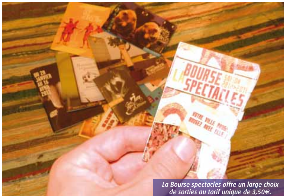
La Bourse spectacles offre un large choix de sorties au tarif unique de 3,50€.