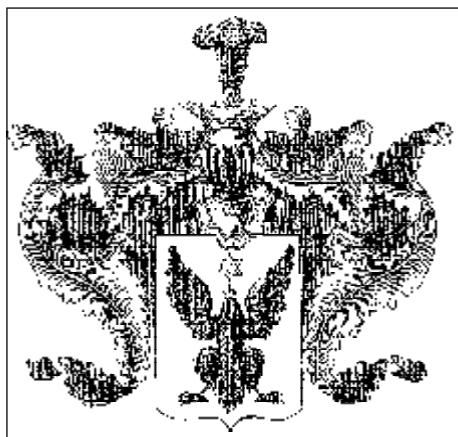
Герб рода Пальчиковых