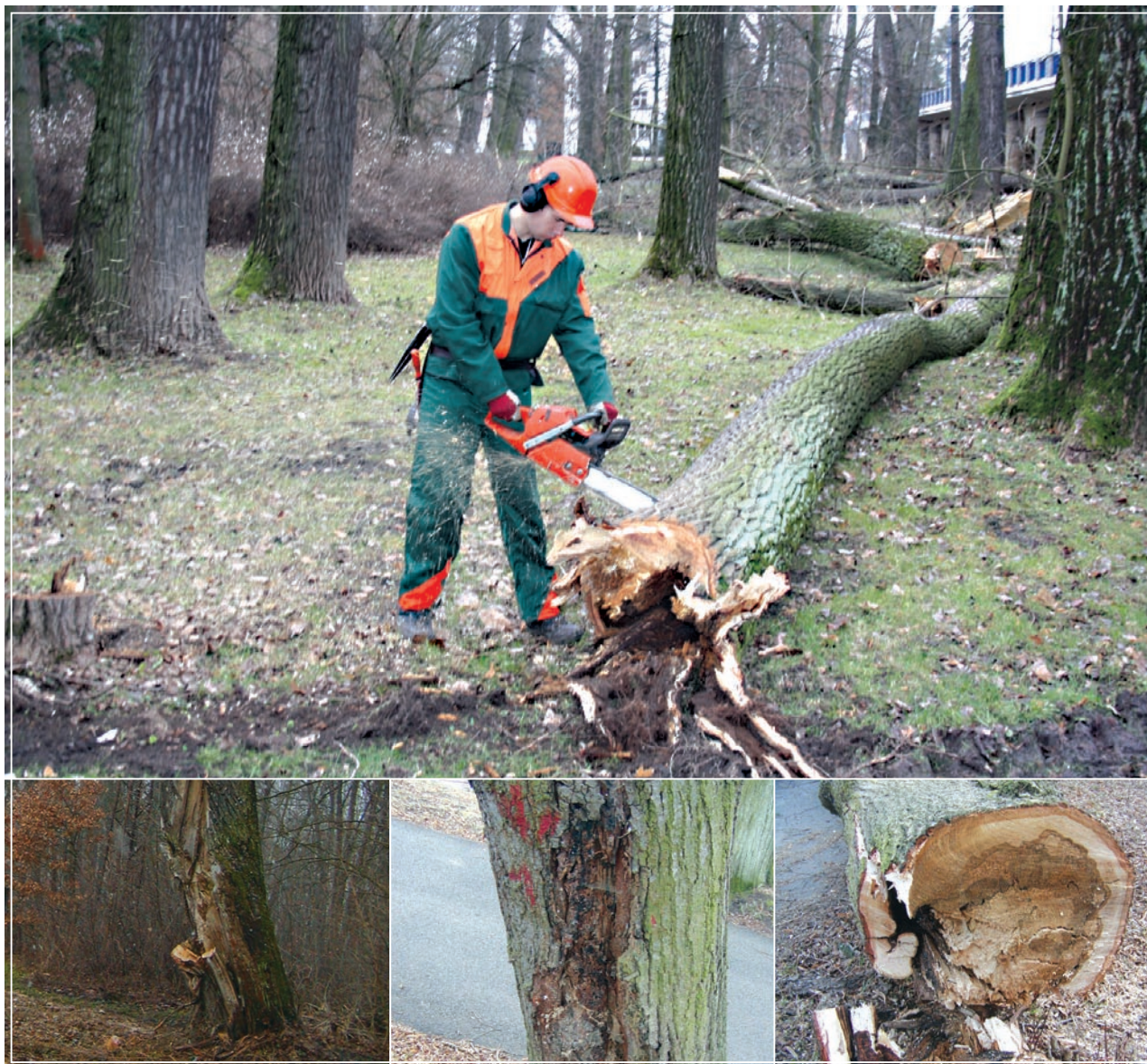
Dělníky s motorovými pilami čeká v Poděbradech ještě mnoho práce. Spousta stromů je ve špatném stavu a musí být pokácena (menší fotografie dole).

„Nejedná se však o zprávu, která nás nějak zvlášť zaskočila. Většinou jde o stromořadí dožilých topolů starších padesáti let. Často mají polámané větve v korunách stromů a jsou napadené chorošem. De facto jsou tyto stromy „sežrané“ zevnitř. Hrozí proto, že mohou například vinou silného větru spadnout, proto musí být pokáceny,“ vysvětlil Vondra.