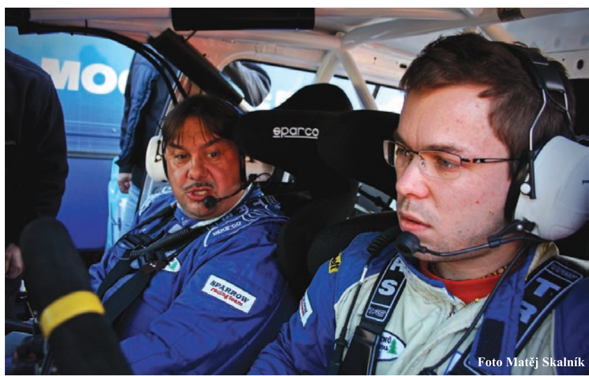
Dunovský má k dispozici nejmodernější techniku