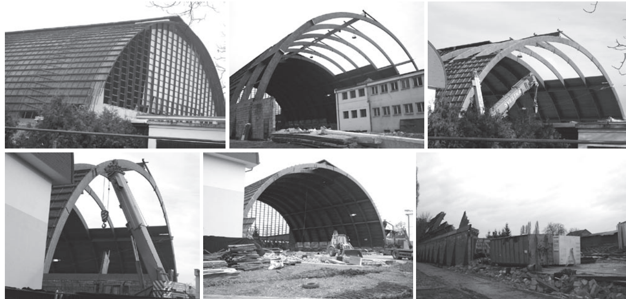
Zimnímu stadionu zazvonila koncem roku definitivně „hrana“

kanalizace. „Tuto sezonu musíme obětovat těm nadcházejícím. Stav střechy zimního stadionu byl totiž zcela v dezolátním stavu,“ dodal Uhlíř. Na jaře příštího roku by se mělo začít s výstavbou nové haly, která by měla být dokončena koncem roku 2012. (aku)