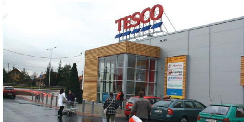
Nové obchodní centrum zve na vánoční nákupy