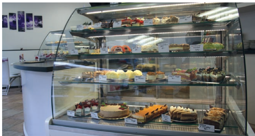
Cukrárna Milano je rájem pro mlsné jazyky

Pro úplnost zbývá dodat, že obchod Elektro Vask se sloučil s Vask servisem v ulici Na Dláždění, kde je tedy vedle servisních služeb nově k dostání elektromateriál a spotřebiče.