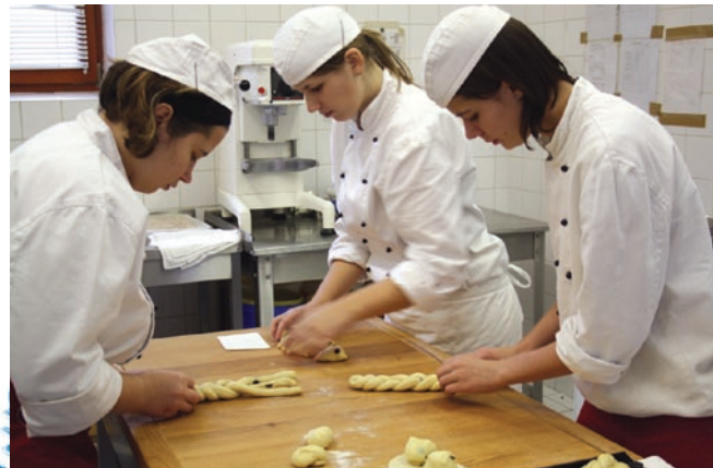
Text a foto (red)

Z droždí, části cukru a vlažného mléka připravíme kvásek. Ušleháme máslo, cukr a žloutky. Přidáme vykynutý kvásek a ostatní suro- viny. Vše dobře vypracujeme v tužší těsto a necháme kynout. Uple- teme vánočky, necháme je kynout, potřeme rozšlehaným vejcem a posypeme mandlovými lupínky. Pečeme cca 40 minut na 180°C. Z tohoto množství vytvoříme 4 vánočky.