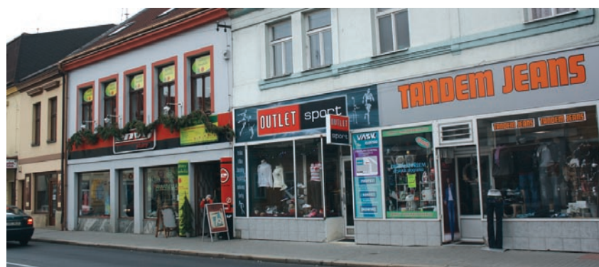
Palackého ulice prožívá novou obchodní „explozi“