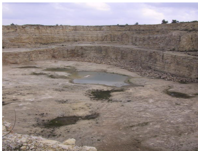
שלולית חורף במחצבה 09.03.09