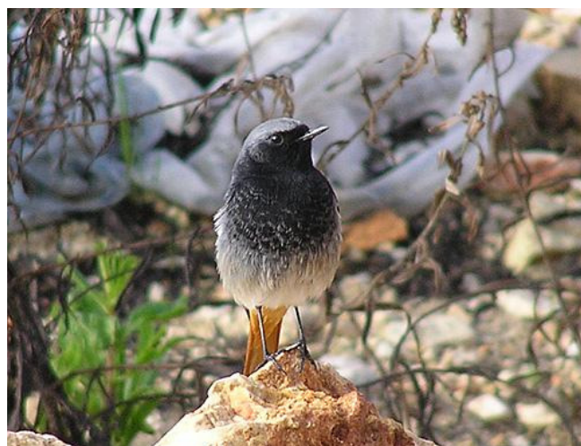
חכלילית סלעים זכר 09.03.09