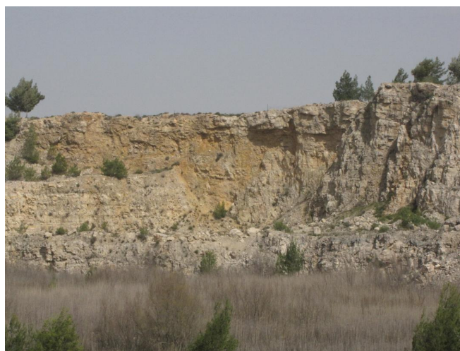
מראה כללי 09.03.09