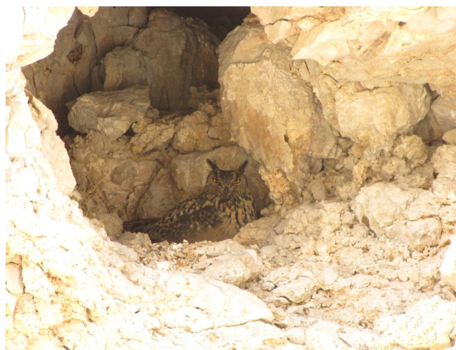
אוח עיטי 09.03.09