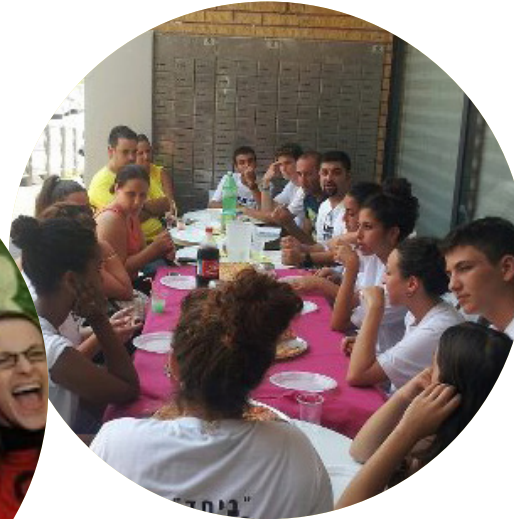
Key benefits of a multi-interface work environment