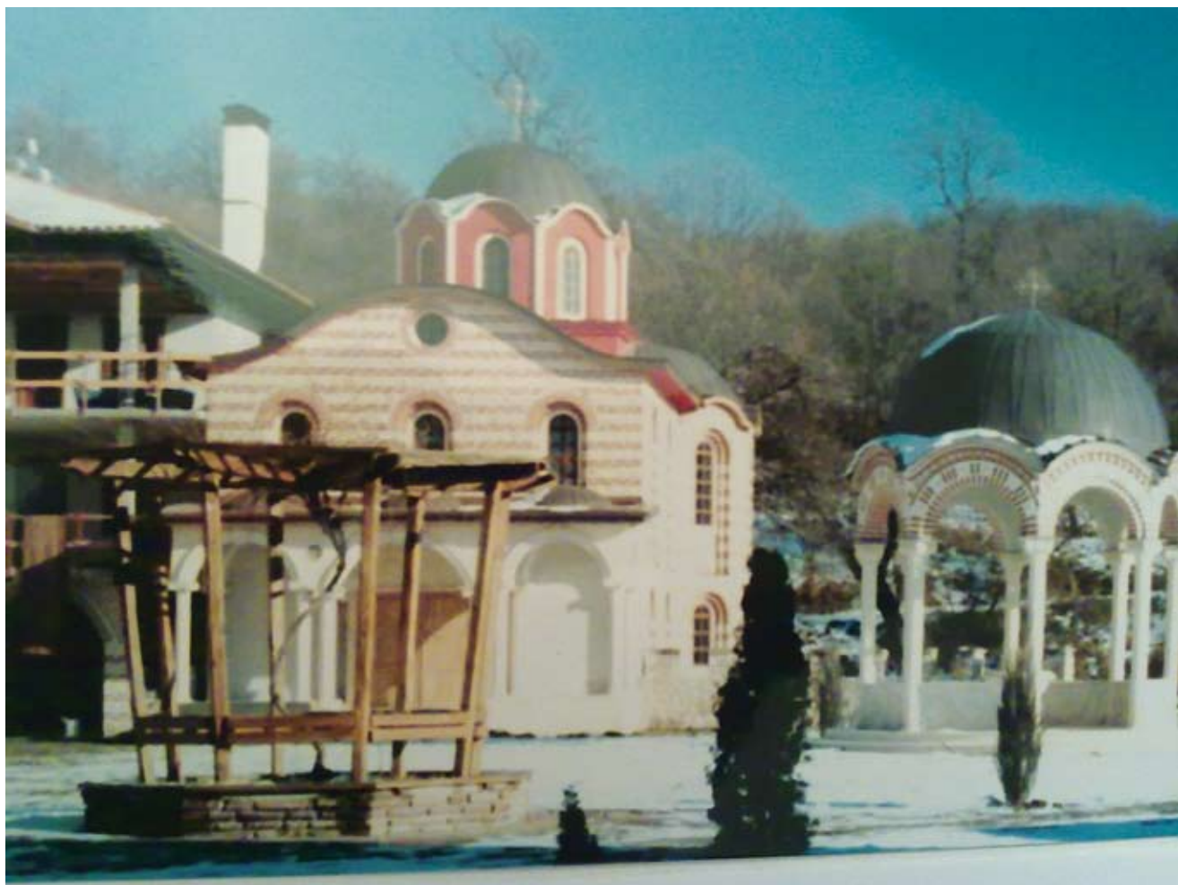
Гигински манастир “Св. св. Козма и Дамян” (новата църква)