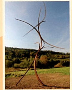
6 „Feuersprung“ 49° 39' 19,7" N 6° 35' 20,2" O