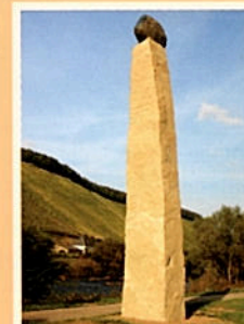
7 „Tulp uit Amsterdam“ 49° 40' 02,8" N 6° 34' 16,7" O