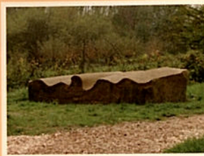
2 „Welle und Falte“ 49° 41' 35,7" N 6° 37' 50,0" O