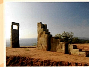
5 „Passagio Animato“ 49° 40' 24,7" N 6° 35' 37,8" O