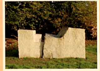
4 „Rast“ 49° 40' 54,5" N 6° 38' 00,2" O