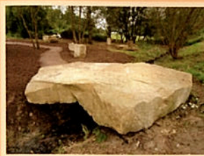
1 „Brücke“ 49° 41' 37,9" N 6° 37' 45,2" O