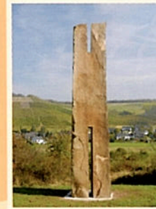
3 „Sentry“ 49° 41' 24,7" N 6° 37' 52,5" O