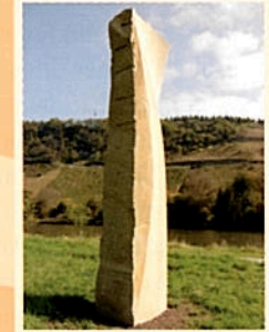
10 „Hoher Dreher Sandstein“