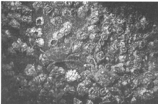
Fig. 2 ➔ Enfouissement partiel d' Hemigrapsus penicillatus . Le céphalothorax est entré en coin par l'arrière. Les péréiopodes 1 et 2 sont en action de rétropelletage. (Cliché TV, 18.02.98, -3 m, bassin Vauban, quai Frissard, Le Havre - Appareil Minolta 8000 i en caisson et 90 mm macro).