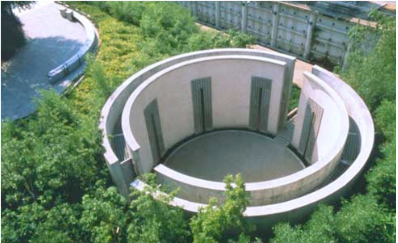
le cylindre sonore, parc de la villette, paris 1987, Bernhard LEITNER

Dans le jardin des bambous, un cylindre sonore forme une sorte de salon en plein air. 24 haut-parleurs sculptent l'espace aux oreilles des visiteurs.