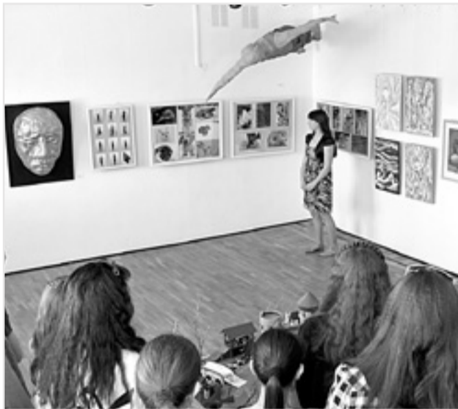
На защите дипломных работ.

Мати РАУТСО, директор художественной школы