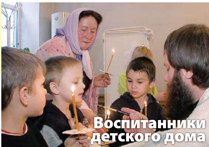
Воспитанники детского дома

Перед принятием Таинства они задавали много вопросов, интересовались, дадут ли им крестик. Во время совершения Таинства самым радостным для детей было держать зажженные свечи. Они старались молиться, окружив «маму»-воспитателя. После принятия Святого Крещения ребятам были вручены детские молитвословы и православные журналы. В следующий раз, по благословению епископа Барнаульского и Алтайского Максима, дети придут в гости в епархиальный Музей истории Православия на Алтае.